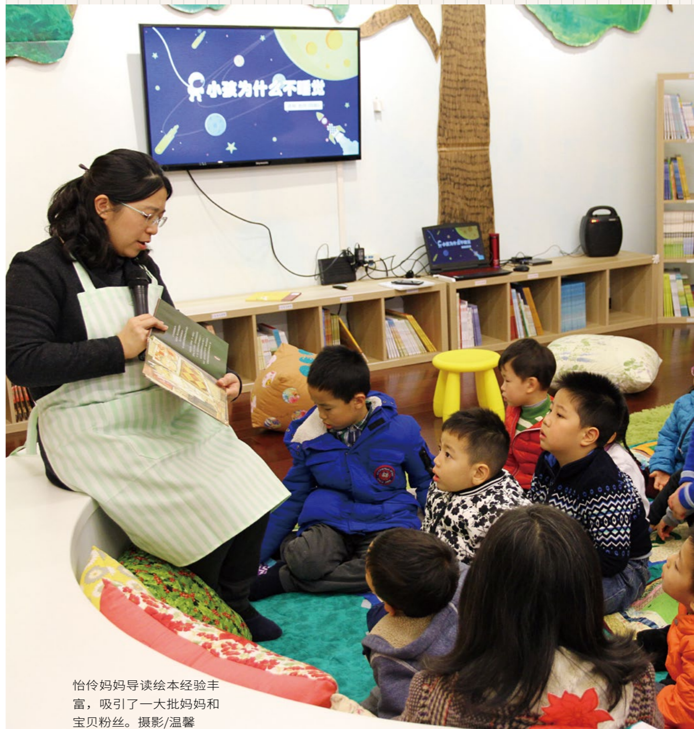
怡伶妈妈导读绘本经验丰富，吸引了一大批妈妈和宝贝粉丝。摄影/温馨