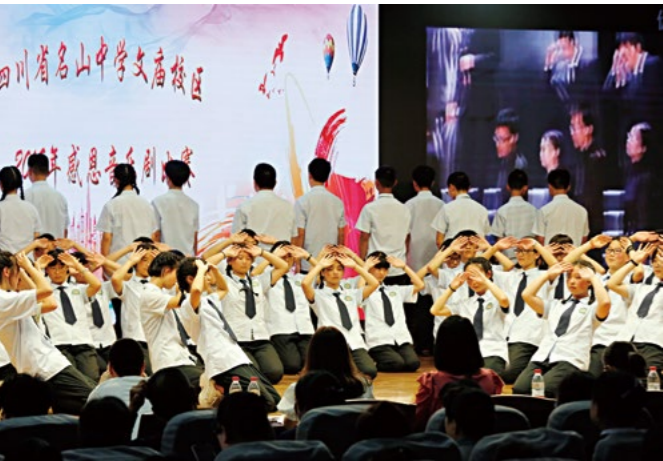
演绎过程中投入真情，从同学们的脸上体会到母亲怀胎养儿的不易。

后，成为了一名住校生：“刚开始的时候会想家，因为有点不习惯，床也理不来。以前一点点事情我都不会做，遇到一点点事情就叫‘妈妈快来帮我，我不会’。但现在自己克服了这些困难，慢慢会洗衣服了、也会理床铺了。”