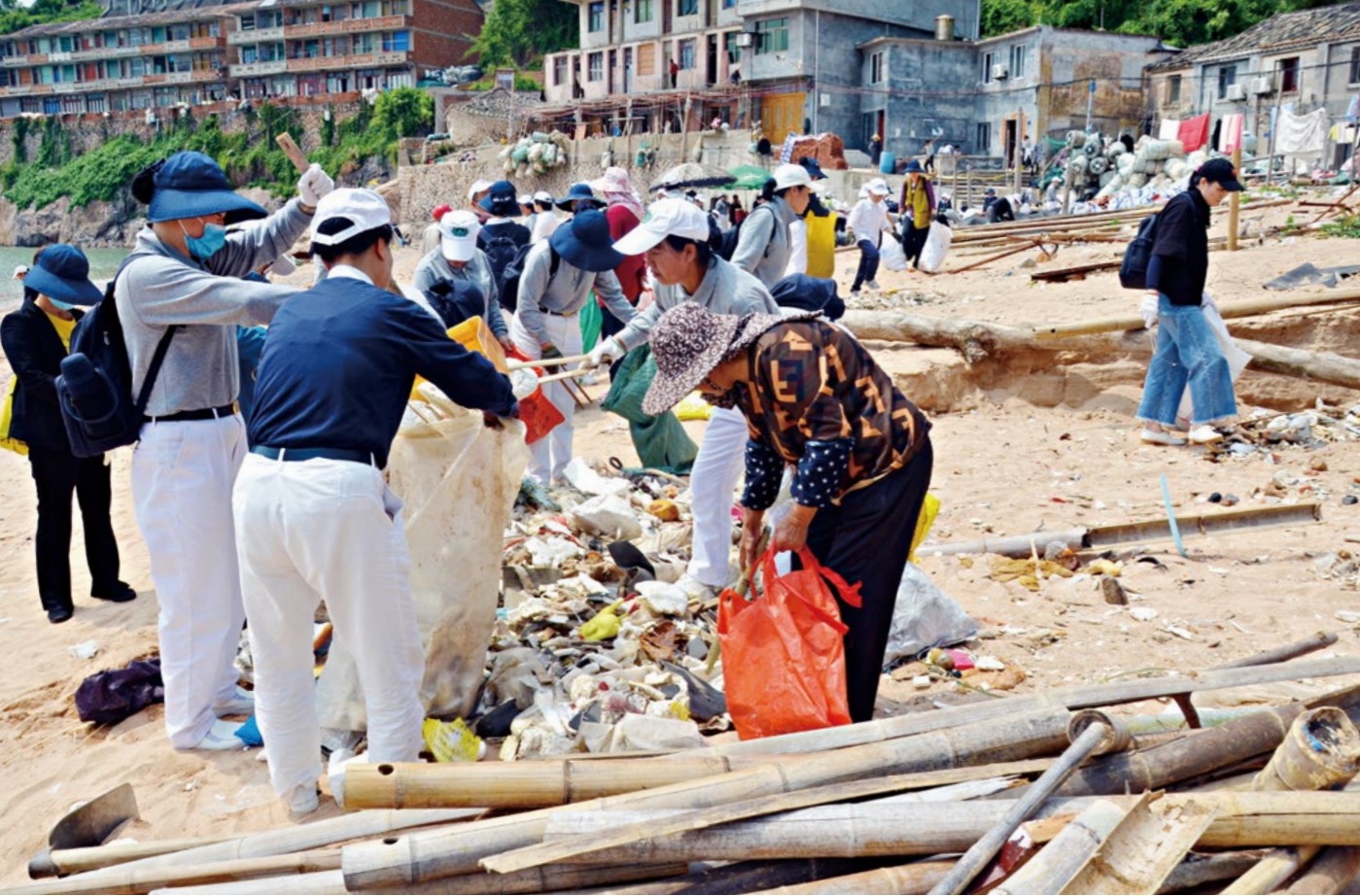
志工把可回收物一袋袋抬到停车场运走，不可回收资源另行处理。

净滩的队伍中，最靓丽的风景线是九对亲子档，在父母陪同下，小朋友们热情高涨地捡垃圾。一个个小胳膊拎着大袋子，都捡的非常仔细。爸爸妈妈也在认真地教小朋友垃圾分类，同时和孩子们分享环保知识。