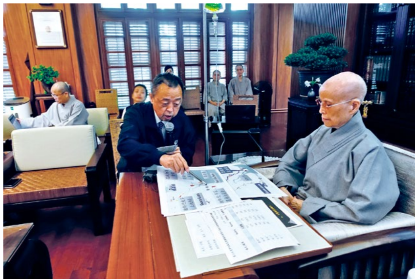
上人聆听思贤师兄报告东非伊代风灾慈济赈灾进度及规画。（4月17日）