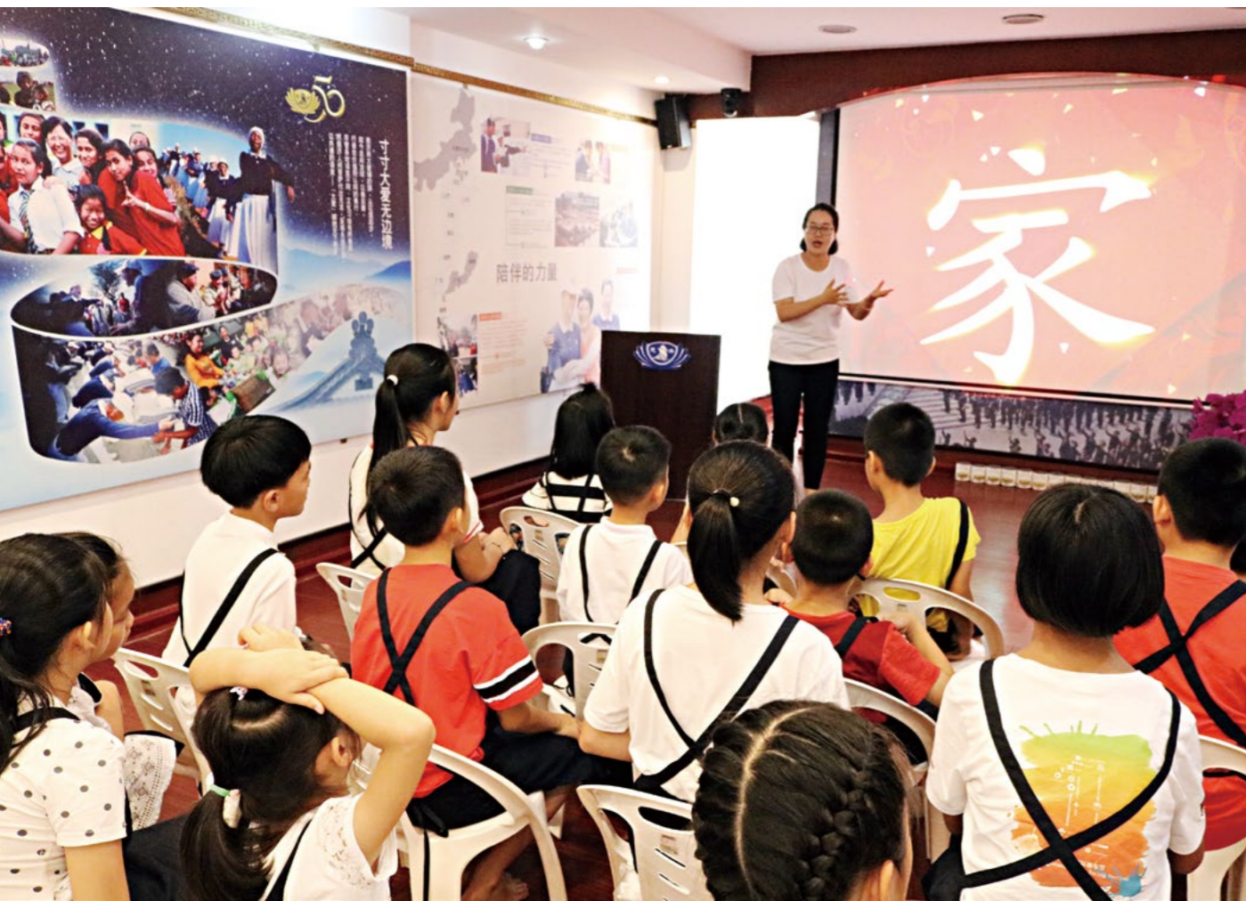
志工向孩子们讲解“家”是温情有爱、安全及幸福团圆的。