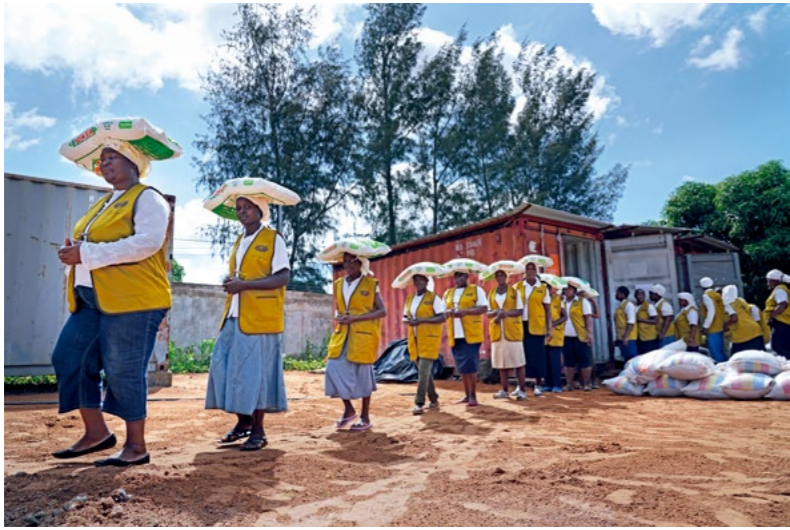
四月上旬，位于莫桑比克首都马普托的慈济园区，连续多日有数百位志工顶着大太阳分装及打包物资，准备送往中部的伊代风灾灾区；包括玉米粉、豆子、盐、水桶等品项，动线明快有条理。