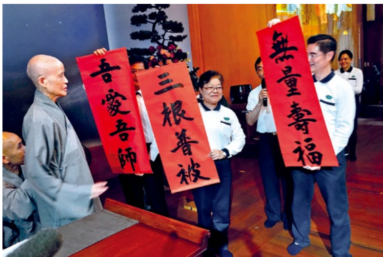
慈济五十三周年庆，教育志业主管于志工早会献上祝福。(4月28日)