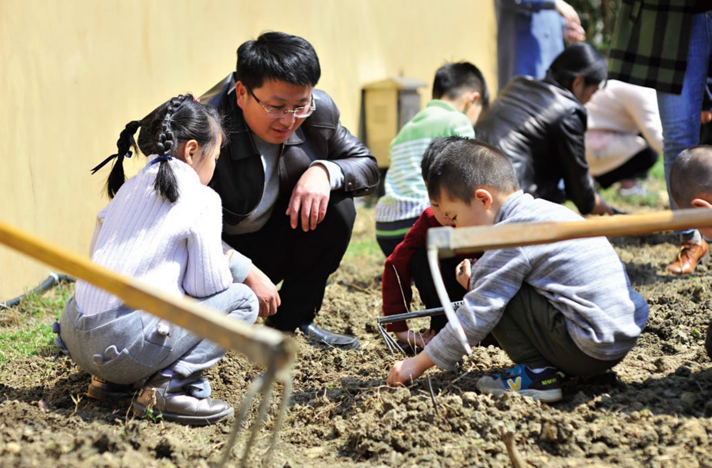
(上图) 孩子们在慈济农场里将种子放进土地，成就亲近土地的人生初体验。(下图) 在大爱妈妈指导下，孩子们变废为宝，让不起眼的“垃圾”变成装点环境的宝贝。