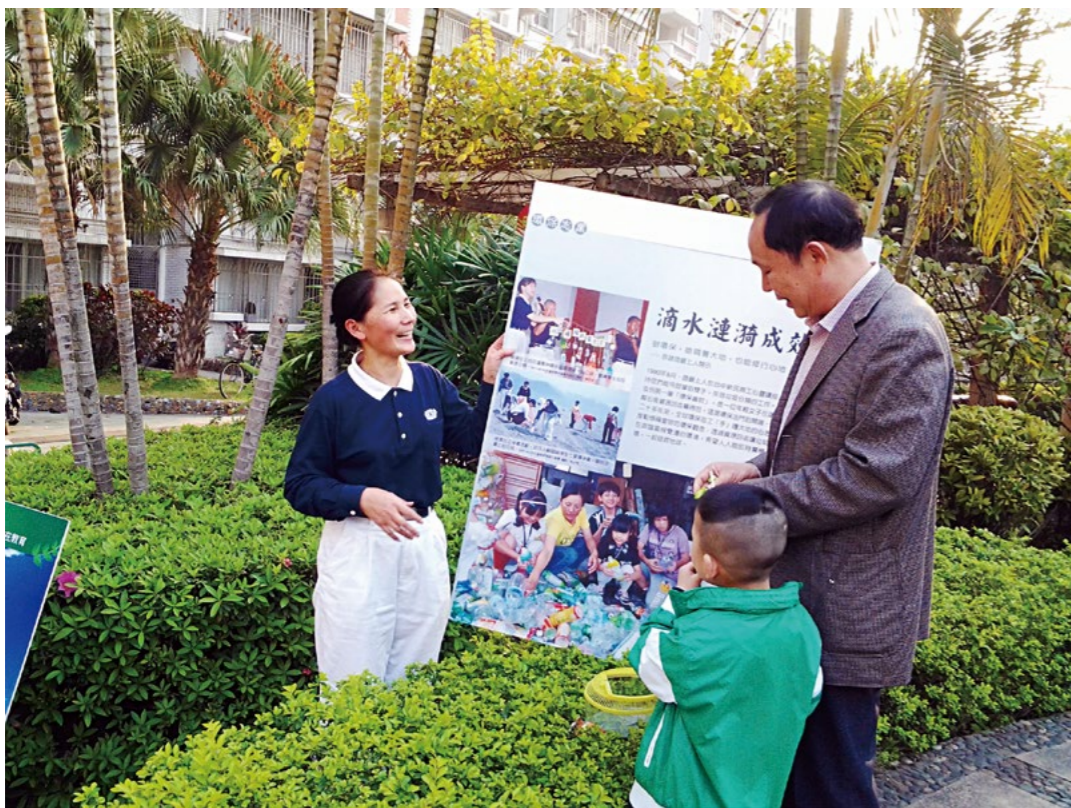
小惠结了许多善缘，邻居们得知她在做环保行善，会主动捐出环保物。

“慈济人在我心目中是万能的，让我非常崇拜。当时我很自卑，觉得大家都会很多功能，我啥也不会。”当时南靖的慈济活动由于人少事多，常常是一位志工承担多个功能。由于不识字，小惠很不自信，甚至自卑，不知道能承担什么功能，让她不禁起了退转之心。