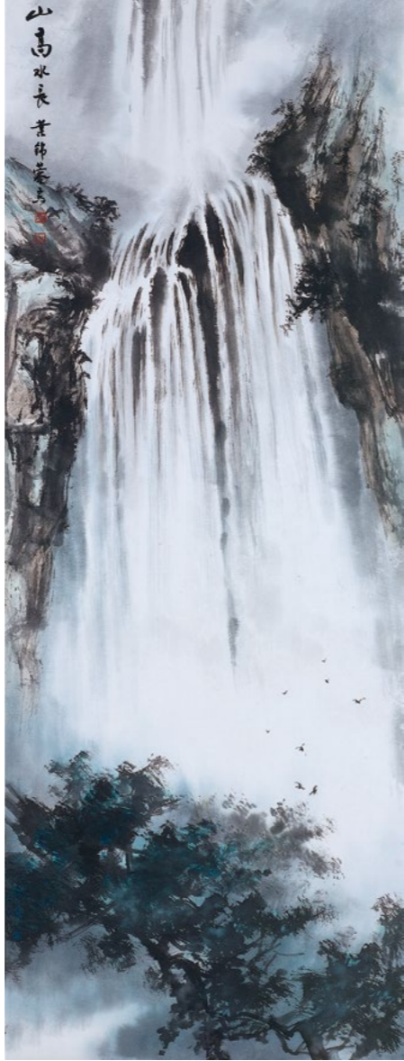
画作 / 叶锦蓉

今年慈济度过五十三周年庆，迈入第五十四年；四月以来，在精舍天天听到朝山的佛号声，看见浩荡队伍，不论年纪长幼，步步精进、念念整齐；虽然每天都有几千人在精舍，但很宁静，人多不吵杂，代表人人都