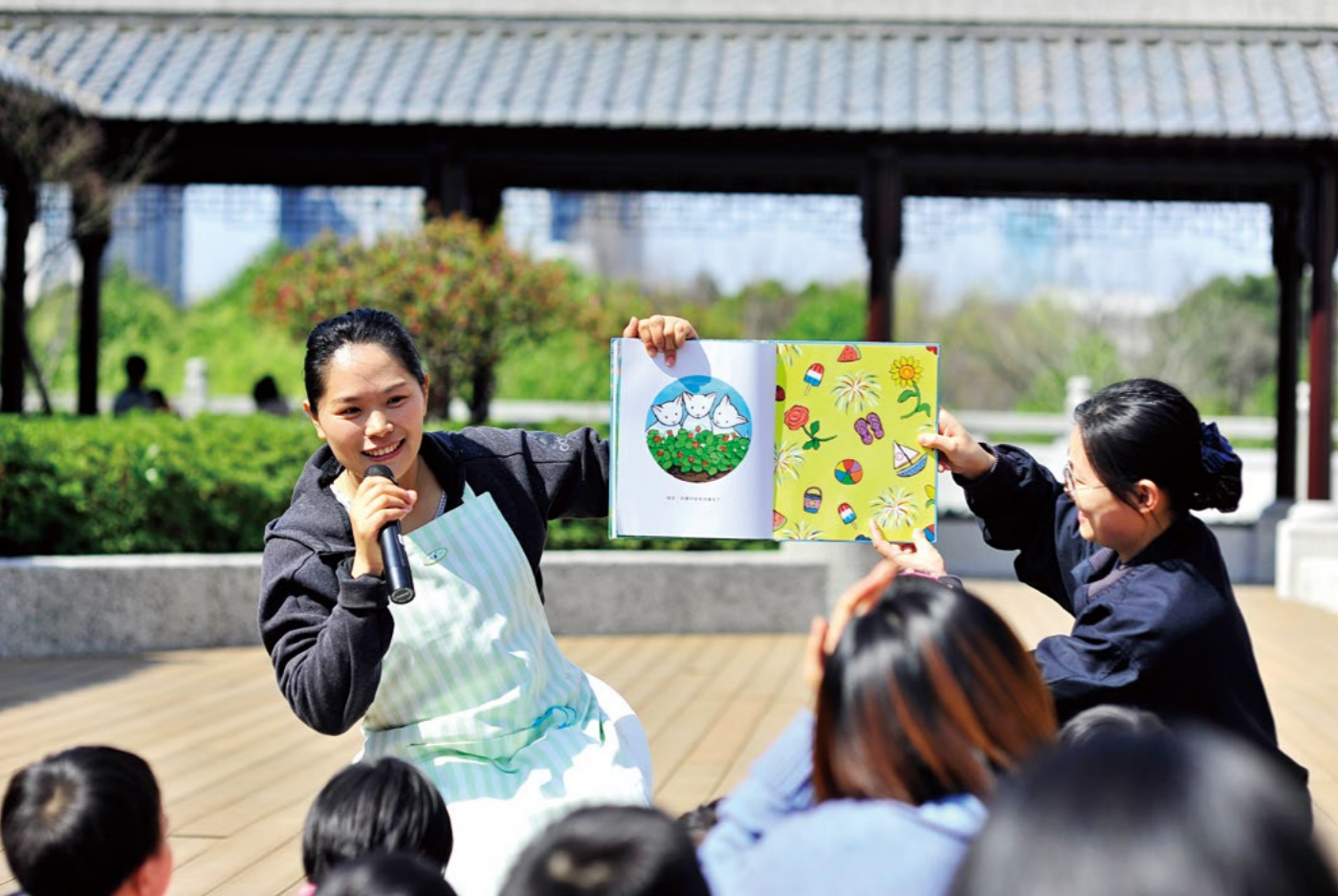
小鹿妈妈（左一）正在认真讲故事，希望孩子们在轻松气氛中领悟人生道理。

抱怨，有时候会情绪失控，找不到其他的疏解出口，经常会迁怒到孩子，甚至会有粗暴一点的动作。”