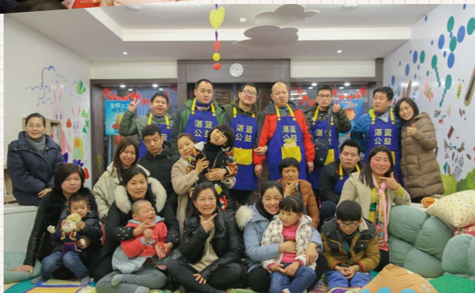
“湛蓝公益”的哥哥们在课堂上带动父母和小朋友联手制作手工皂。