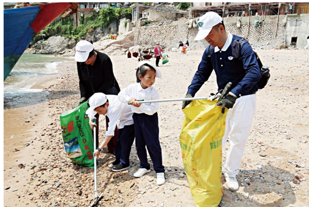
爸爸妈妈认真教小朋友垃圾分类，小朋友们捡得非常仔细。

慈济志工带动黄岐村资源分类回收已经六七年，有一部分当地村民也开始坚持做环保。今年的母亲节，志工透过身体力行的付出，让更多本地村民实践环保理念，守护家园，将环保落实到日常生活中。 [图]