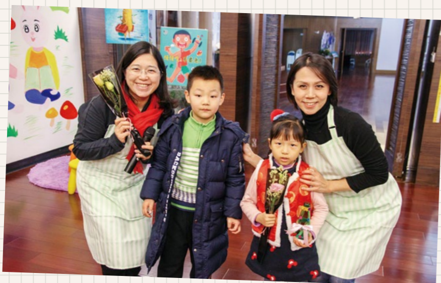
台湾致力于有机农业的志愿者（右一）来到故事屋推广食品安全理念。

故事屋的上海导读人，与之沟通导读相关主题、注意事项、交通线路等很多细节，并且全程陪同上海人医到苏州慈济志业园区，任劳任怨地配合完成一系列工作。