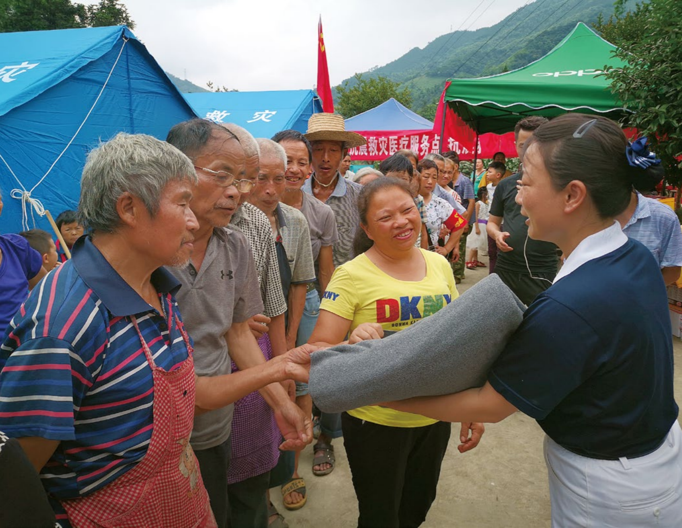
志工向民众展示慈济的环保毛毯，鼓励大家动手做环保。

志工带动小朋友向安置点的工作人员表达感恩，营造正向感恩的氛围。工作人员听到小朋友说“谢谢你们”后笑得好开心，志工鼓励小朋友每天向辛劳的工作人员道感恩。孩子们表示每天下午两点会一起向工作人员道感恩。