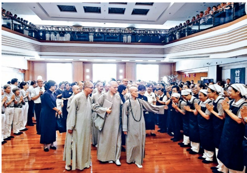
来自九个国家和地区三百多位慈济志工于三重静思堂参与第二梯次全球四合一干部精进研习，营队工作人员喜迎上人抵达。（6月16日）