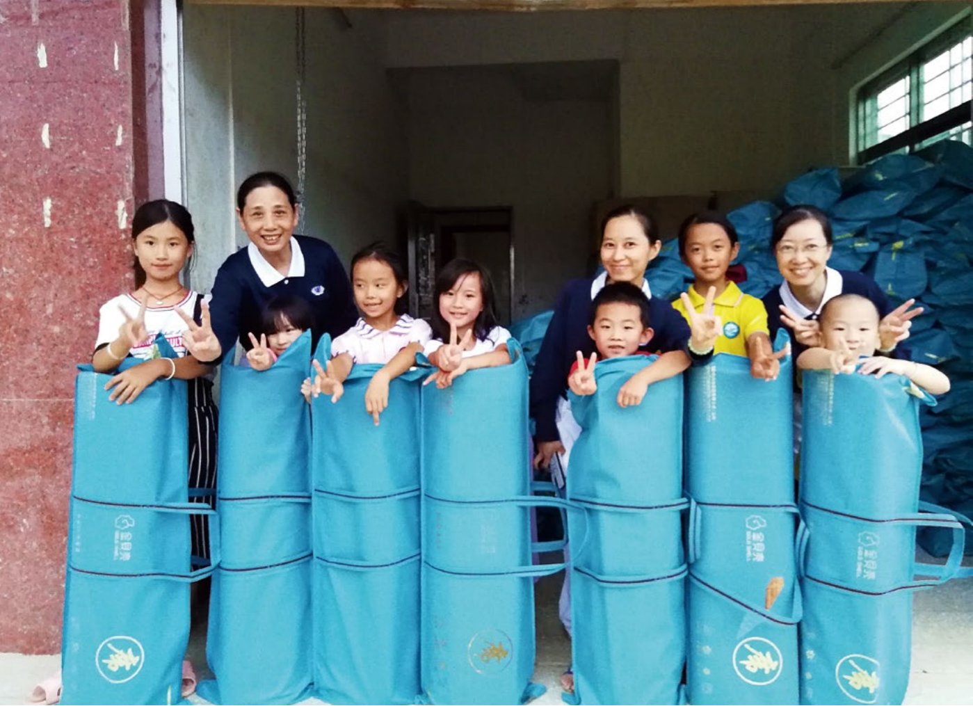
娃娃组成的“蚂蚁雄兵”很期待明天能继续帮忙搬运物资和服务大家。