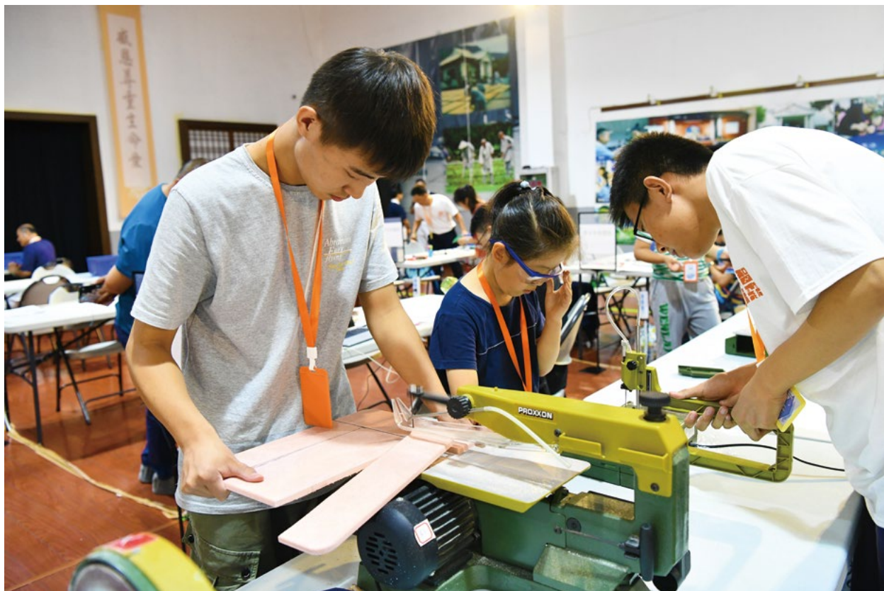
撰文/毕可琴 徐华 摄影/许丽梅