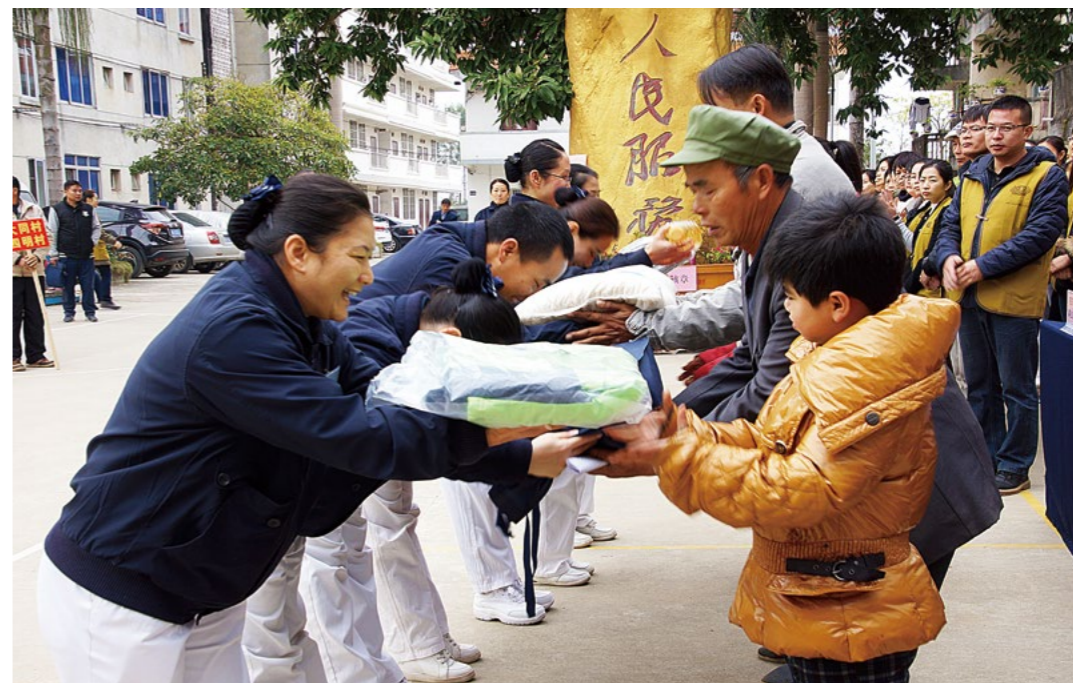
华南慈济志工双手恭敬地为武鸣区四百四十五位乡亲送上大米、食用油、毛毯、夹克等冬令物资。