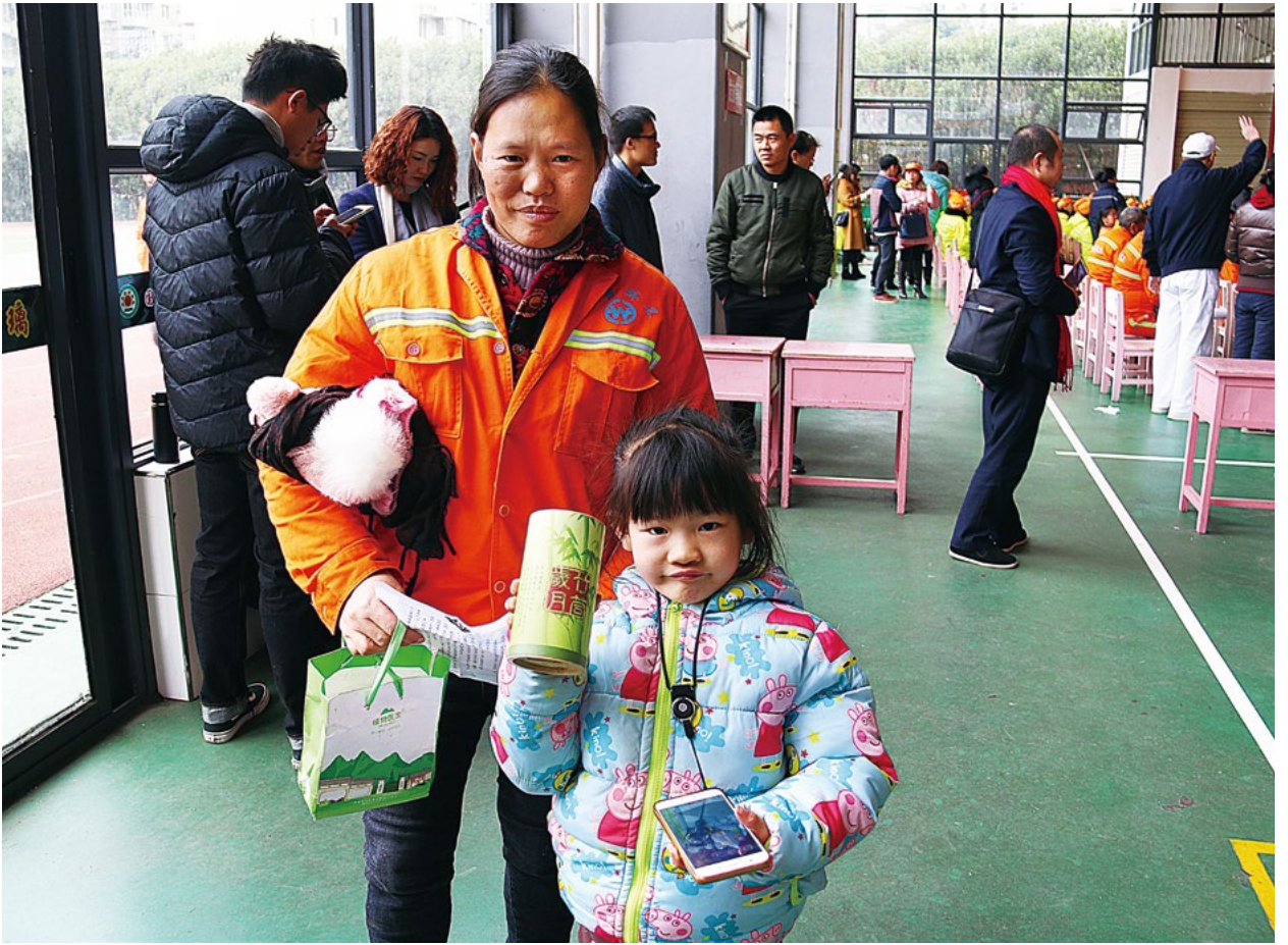
撰文/摄影 湖南真善美志工