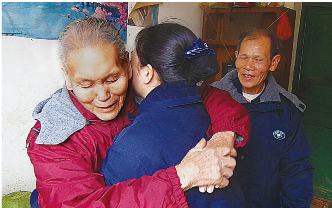
李奶奶看到志工宛如自己的儿女，紧紧拥抱，希望志工春节有空来家里过年。