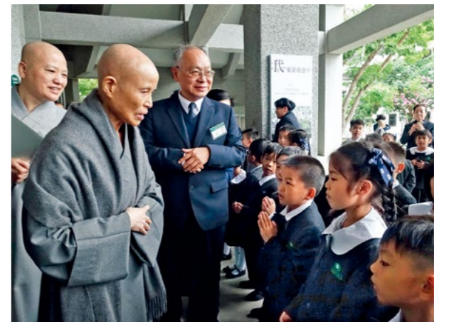
▲台南慈中十周年校庆，国小部低年级孩子们恭迎上人，并礼貌问候：“师公上人好！精舍师父好！欢迎来到我们的学校”。（12月8日）

台南慈济高中创校十周年，举办校庆活动，全校师生、家长与慈懿会喜迎上人莅校。上人欣言，十年前台南慈中小学开学不久，同样在活动中心对大家讲话，当时台下