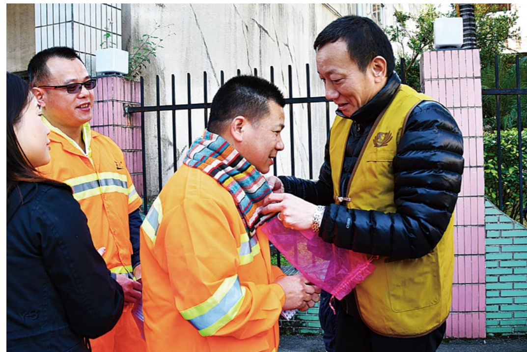
志工亲手把围巾围在环卫工身上，把众人的爱与祝福带给他们。摄影/林家如

（上图）供应商郭记轴（中）看着志工发放物资时的恭敬态度，也跟随着志工，弯腰微笑，将物资发到环卫工人的手中。首次参加活动的他说：“虽然我不大认识慈济，但我学习到行善的态度，谢谢你们！” 摄影/林家如