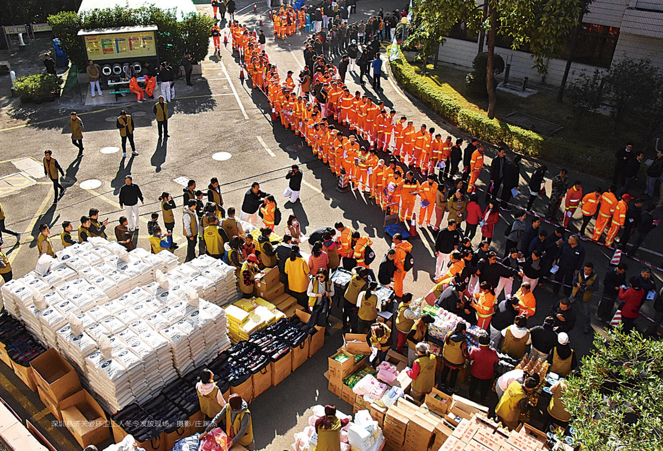
深圳慈济关爱环卫工人冬令发放现场。