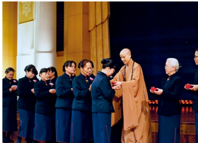
喜见慈济家庭添丁，上人在高雄第一场岁末祝福典礼中，为一百零四人授证慈济委员、慈诚及荣董。（12月11日）

上人叮咛，在面对反对或质疑声浪时，必须将心门守好，让杂音从耳根接收后，心灵不受伤害，同时也深入思考，慈济成立骨髓资料库，是为了救人，重建血液疾病患者的造