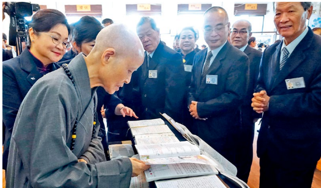
▲ 来到云林联络处主持岁末祝福，上人翻阅师兄师姐的闻法笔记。（12月4日）

“人生之苦以病苦为最，人间也没有比生命更有价值的；医师拔除病苦，是生命的再造者。”上人说，如果以商业服务来看待医疗，或是医师松懈了自己的精神形象，人们就容易对医疗人员丧失尊重感，也不信任，就会影响医病关系。