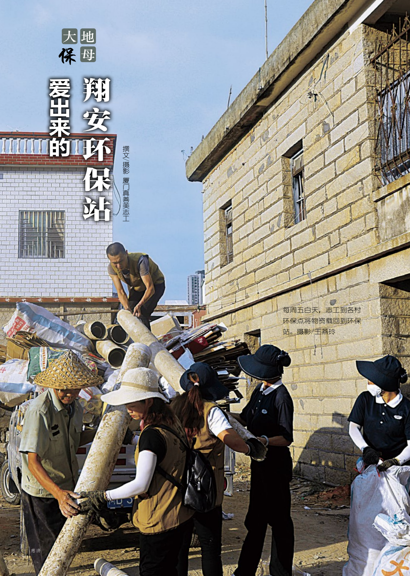
每周五白天，志工到各村环保点将物资载回到环保站。