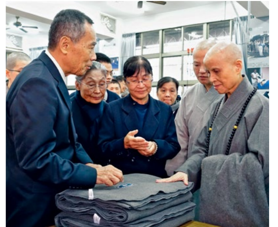
▲ 高雄冈山志业园区大爱感恩科技巧艺坊于二〇一七年九月开工，分担赈灾环保毛毯的织制供应。上人表示，有众人爱的凝聚，才能守护大地也抚慰人心。（12月9日）

老师盼望学生拿到好成绩一样；为人付出、与人结善缘，自做自得、自修自得，功德分分已获；不必等到往生才由子孙‘做功德’，现在就要闻法入心，积极认真地走这条人间菩萨道。”