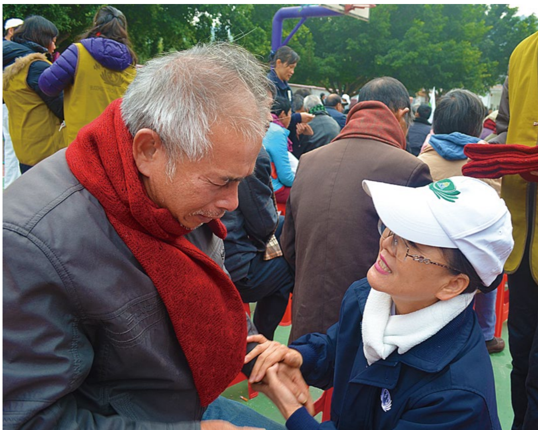
乡亲戴上志工自己制作的围巾后感动落泪。