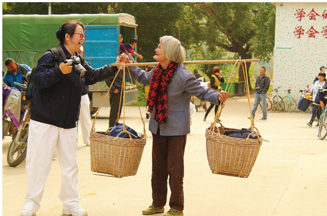
“再见，谢谢你们！”奶奶挑着两筐满满的冬令物资与志工欢喜道别。