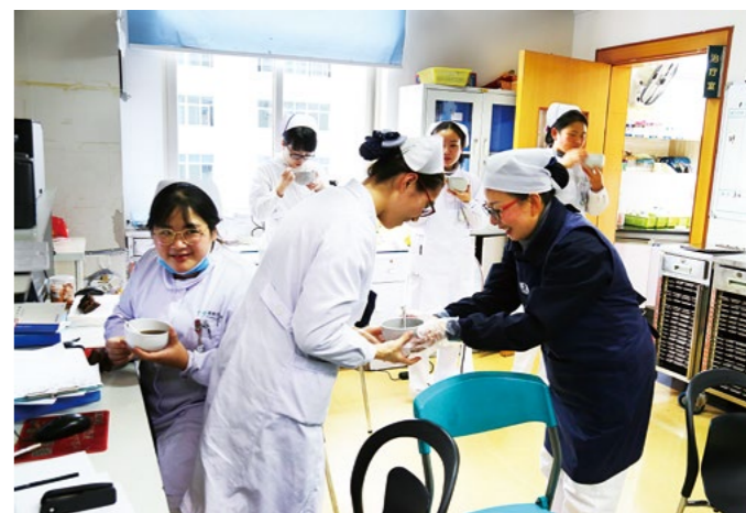
（上图）儿科一区的医生护士们看到志工的到来，迅速上前迎接。