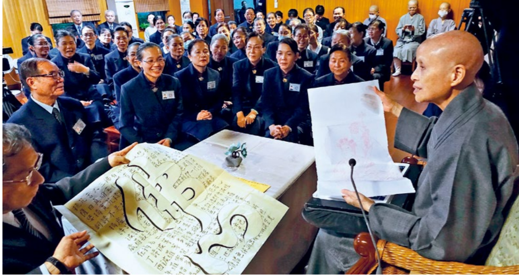
▲台南监狱关怀团队呈收容人书画作品予上人。谈及收容人戒断毒品的痛苦，上人教众守护心念，莫一时松懈而偏离正道。（12月7日）