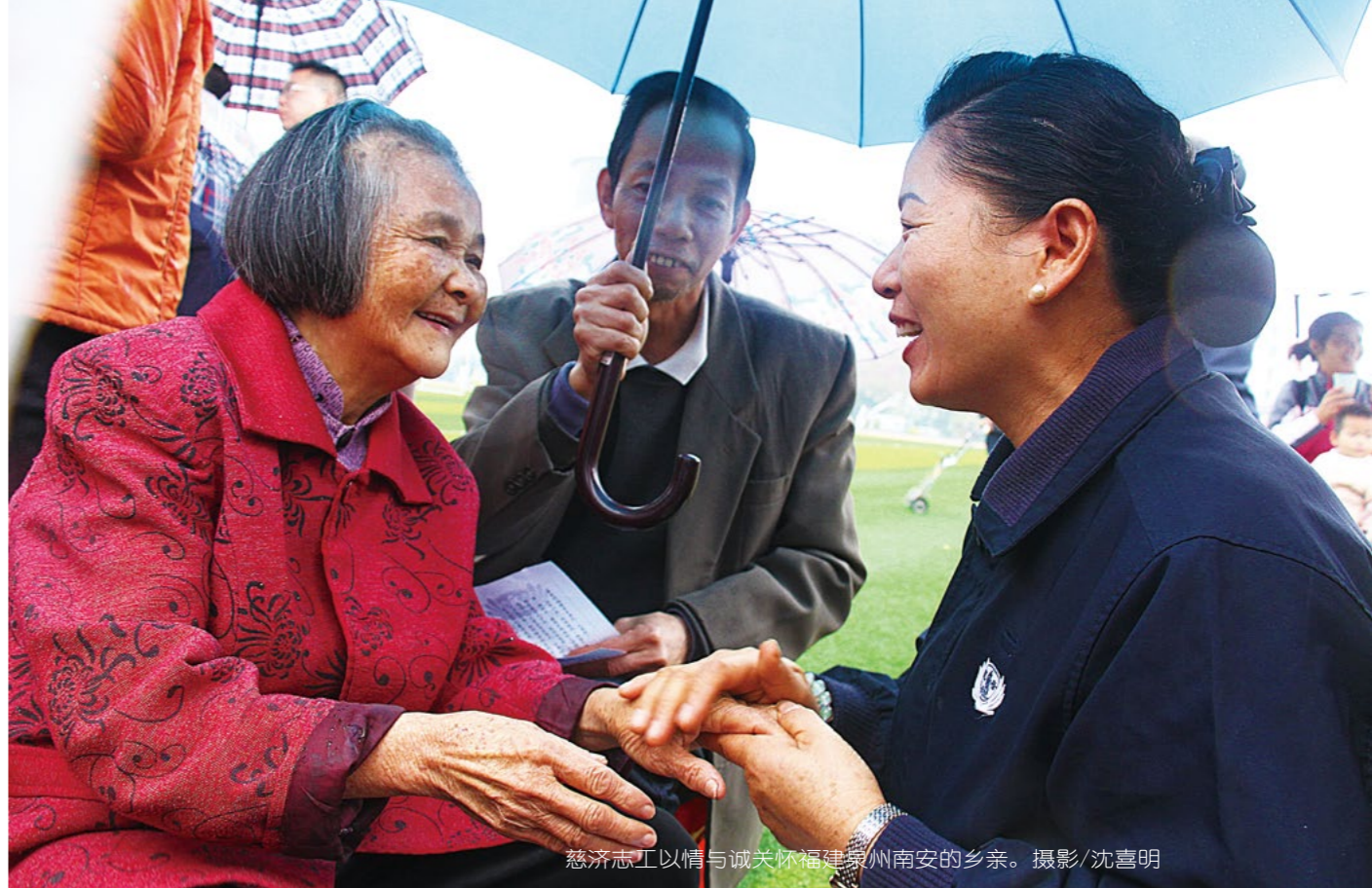
慈济志工以情与诚关怀福建泉州南安乡亲。