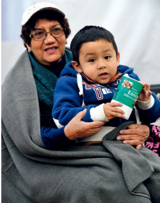
▲ 来自台湾志工回收宝特瓶所制成的环保毛毯，漂洋过海温暖墨西哥强震后的居民。

“骨髓库成立二十多年了，年年都有捐受赠者相见欢；见证这么多人因此得救，慈济人是否都很清楚了解？旧法新知，明白来龙去脉，无论‘无明风’从何而起，应该都能够自信地一一对人解答。如果不清楚慈济所做，对自己为什么