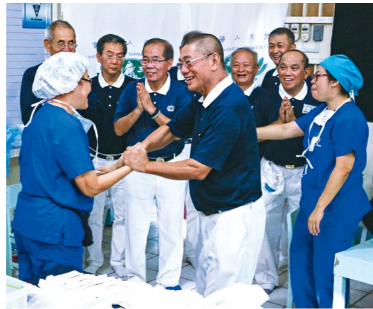
◀ 海燕台风二〇一三年十一月重创菲律宾中部，慈济志工启动“以工代赈”，让独鲁万市重返生机；五年后、二〇一八年十月下旬，慈济在独鲁万礼智兴华中学举办义诊，志工向医护人员致意。

慈济人跨族群、跨宗教的无私大爱，感动了原本对立的族群与村落，于一九九五年七月，南非约堡索桑谷维地区民众，成立社区发展委员会并举办“和平烛光晚会”，大家共同祈祷并宣誓停止种族、政