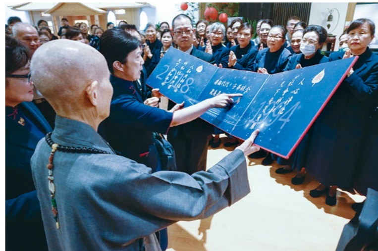
上人从台中北上抵达新店静思堂，北区慈济人呈大型福慧红包子上人。（11月24日）

上人说，最近常常教大家“把握时间，利用生命”为大地人群付出；有的人还会计较，觉得被人利用了，很不甘心；但其实是要说声恭喜：“你的生命还有价值，还有人要利用，应该要感恩！”有用的生命才有价值，而且要用于利益社会、守护大地众生。