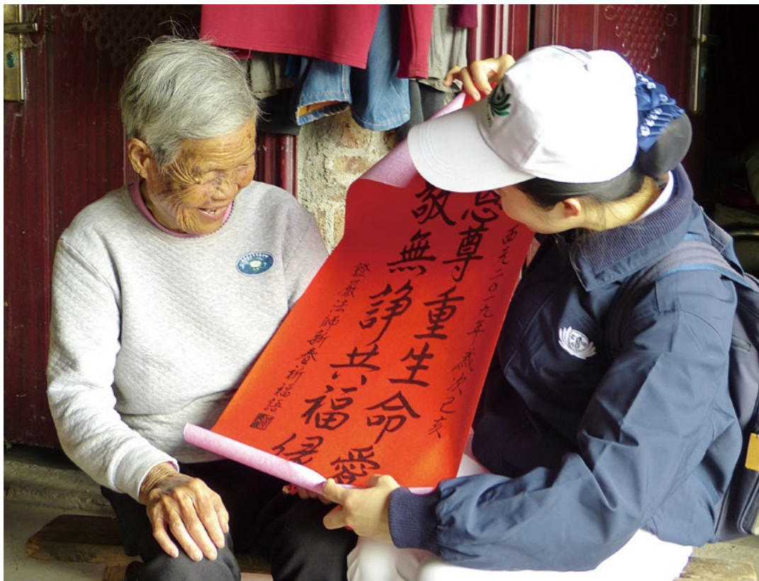
志工拿出慈济春联，陈奶奶欢喜道谢，还夸慈济棉衣好暖和。

的，是真心实意为贫苦人付出的。他对慈济人的评价是：“高效有序接地气，温暖贴心更有爱。”