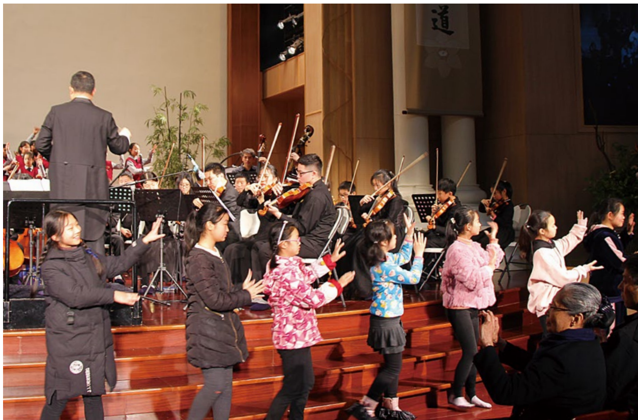
撰文/宋燕溟 孙晓梅