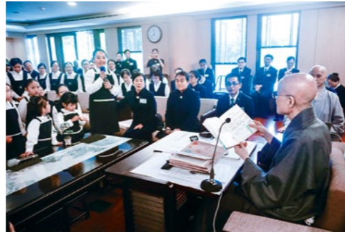
于桃园静思堂，静思书轩小志工向上人分享薰法心得。（11月18日）

冬天的寒意，天候舒适，上人教大家感恩身在台湾平安有福，虽然今年初有花莲的强震、八月时南部豪雨成灾，但台湾各界的爱心能量很充足，善与爱的力量快速抚平创伤，让社会很快安定下来。这分爱心善念也要时时启发与培养，一旦有无常意外发