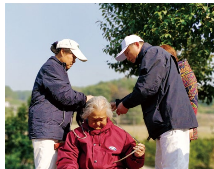
九十岁丰奶奶一个人生活，志工帮她洗澡，换上新棉袄，擦上护肤霜……

临别时，志工赞叹孙女对奶奶的态度改变，祝福她全家幸福美满。奶奶坚持把志工送到路边还依依不舍，以手拭泪。看到这一家的改变，就如同她家门口黄橙橙的橘子，越来越甜、越来越好，回访的慈济志工无比开心，更发愿持续关怀陪伴，让大爱遍满这“柑橘之乡”。