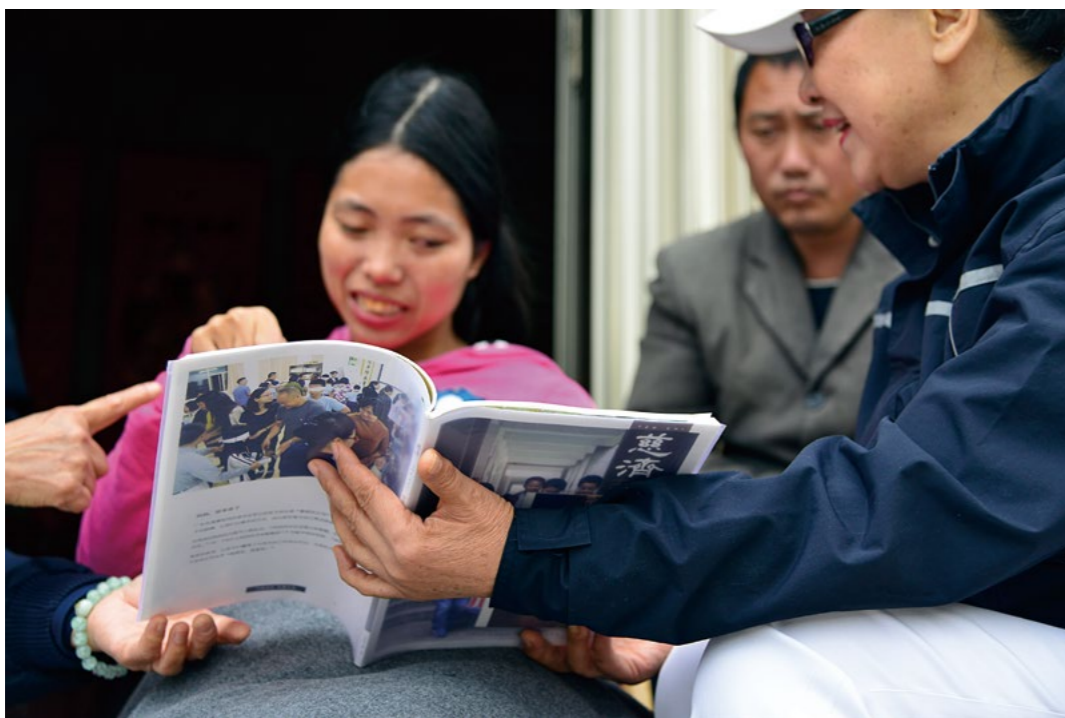
阿秀非常感恩慈济的长期关怀，把慈济月刊当成宝，特意用塑胶膜包起来。

经济来源，仅靠小儿子在外务工来维持四口人的生计。罗奶奶照顾一双年幼的孙子，儿媳妇煮三餐给他们吃。