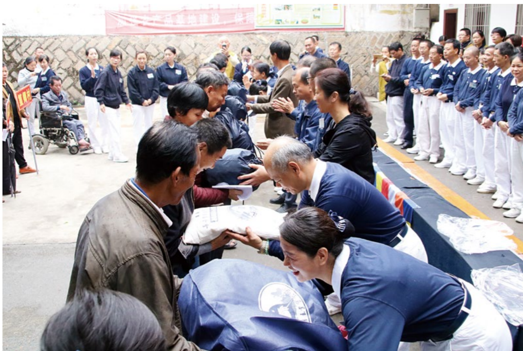
漳州十年的寒冬送暖，从最初的一万多户到如今五百多户，可见乡亲们生活越来越好。

来领取物资，每一年的物资就像志工为他精心备好的年货，可以让他安心过好年。当领到物资时，他感动地说：“感恩慈济一直以来的大爱，真正服务到家。有了这些物资，过年就更舒心了！”