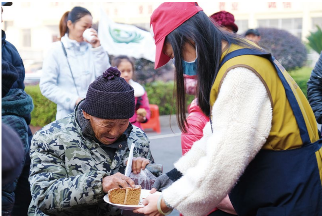
独居的曹爷爷缺少家人陪伴，志工从家里带来蛋糕送给他吃。

实际上，志工与乡亲很多都彼此相熟，因为今年夏天曾到过他们家。久别重逢，更是一见如故。杨坪村的邓奶奶，紧拉着志工陈敏的手，像孩子般又蹦又跳、又亲又抱，如同母女。