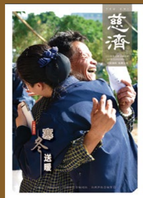
封面图说： 十二月二十二日，慈济志工来到福建惠安县黄塘镇，为当地乡亲送来冬令物资。