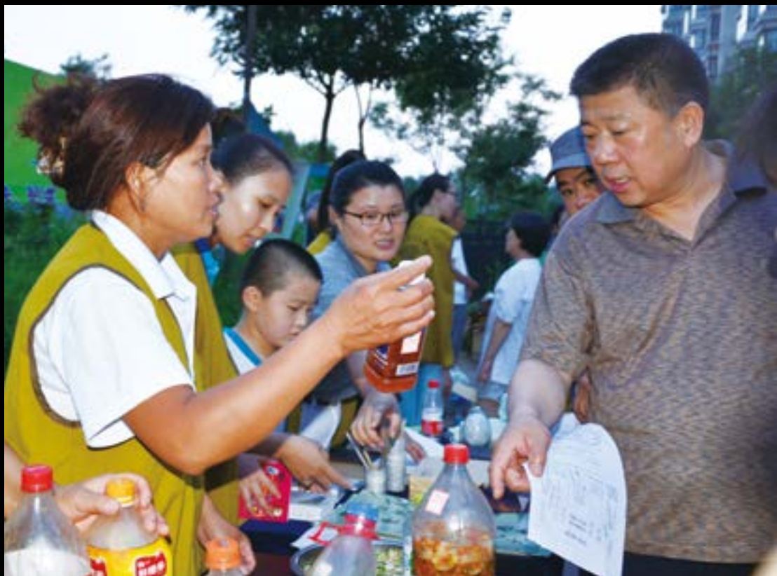
志工向小区民众介绍环保酵素的优点以及制作方式。

很投入，不仅到东花市会所参加共修，还参加易县助学访视活动：“见苦知福，也恍然大悟自己的生活其实很幸福”。