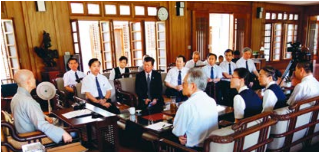
上人致勉大爱台同仁，要作社会人群的眼目，提高民众的智识与道德观念。（7月4日）

“电视台要作为社会人群的眼目，提高观众的智识与道德观念；大爱台认真制作清流节目，真正发挥净化人心的良能，期待这股正向的传播力量能获得各界的肯定与支持，才有助于导正媒体方向与社会风气。”