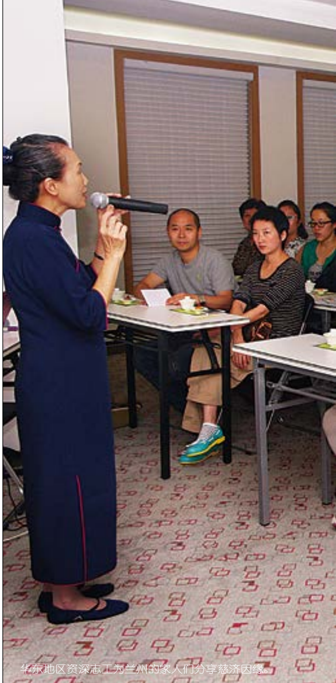
华东地区资深志工为兰州的家人们分享慈济因缘。

自春师姊参加上海海洋酒店的一个工作课程时，恰巧慈济在酒店做环保倡导活动，一身蓝天白云的制服吸引目光，一句静思语“甘愿做、欢喜受”，改变生活。2013年元月初至北京书轩，映入眼帘的情景，让人有回家的感觉。随后主动与上海慈济志工联络，并积极的参加小区志工培训课程。