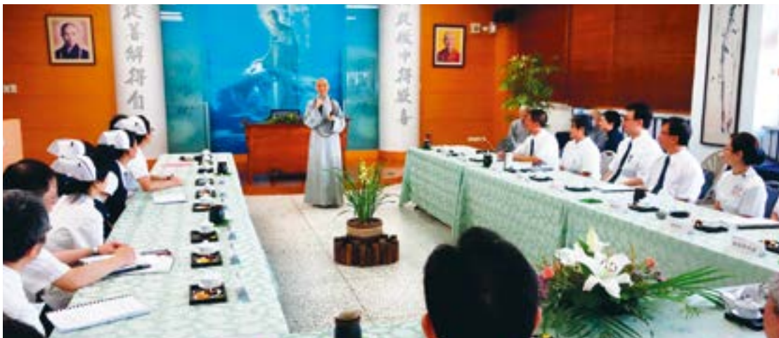
玉里慈济医院将接受医院评鉴，上人期勉同仁以感恩心接受评鉴，为医院进行“总体检”。（7月8日）