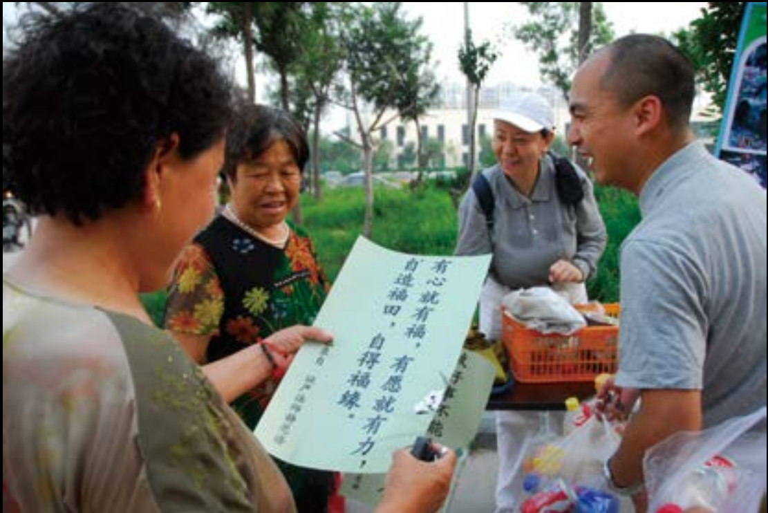
(上图) 除了环保知识，静思语也是小区居民喜爱的结缘品。 (下图) 在小区民众积极提供回收物之下，高级商务车转身成为爱心环保车。