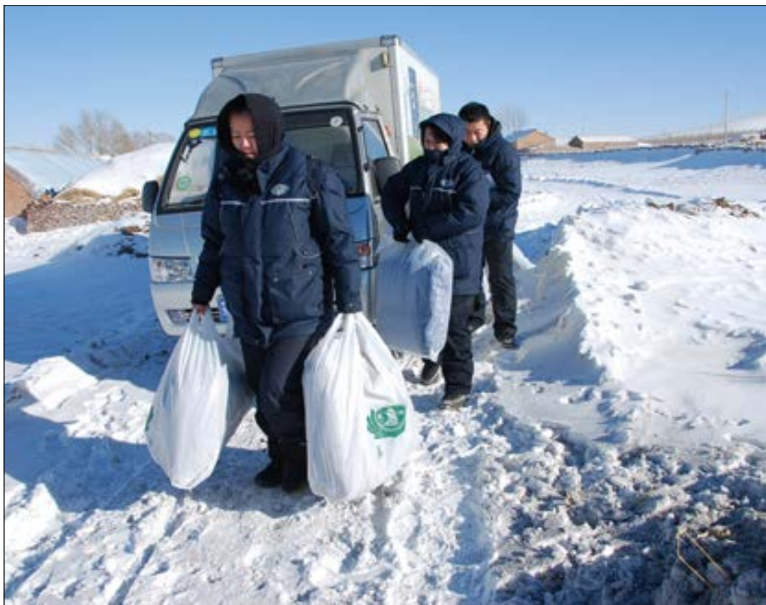
今年年初志工在内蒙古大雪严寒中发放生活物资的情景。