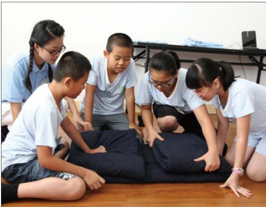
学员分组学摺棉被。快乐健康营从孩子的衣食住行开始教育，矫正许多小王子小公主的生活习惯。

短短几个小时的课程，于午斋看得到成果；平时里，吃饭不是很守规矩的小学员，都显的安静，没有在家里吃饭的那样随意。有的小学员虽是初学食的威仪，多能很好地呈现威仪之美，学着龙口含珠、凤头饮水食的威仪，也是似模似样。