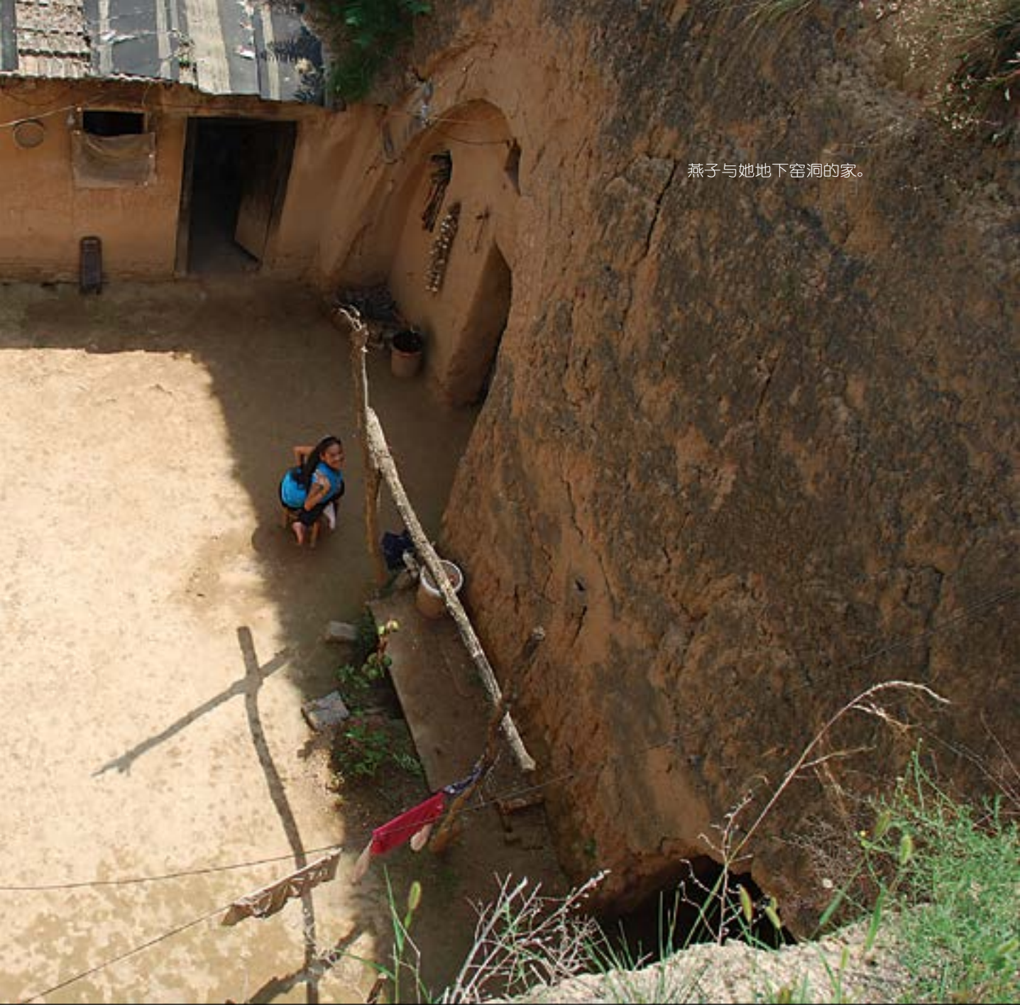
燕子与她地下窑洞的家。