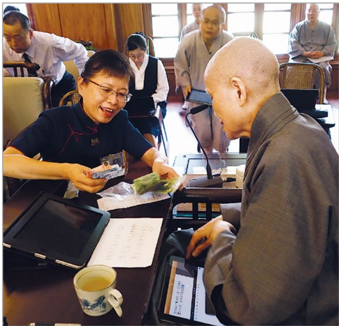
莱索托陈美娟师姊敬呈当地志工为菲律宾海燕风灾所募之善款。上人赞叹当地黑菩萨，虽处苦恶之地，却能步步生莲，在沙漠中化出绿洲。（4月17日）

凡夫心起伏不定，善念难以恒持。上人教众掌握正向、固守心念，一心一志、踏实精进于菩萨道上。“以平