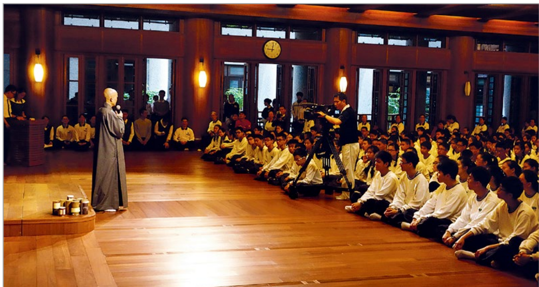
花莲慈济中学十公里路跑，师生们沿着“师公路”跑回精舍。上人期许大家，维持此刻“自爱爱人”形象，努力充实自我、为天下人群付出。（4月19日）