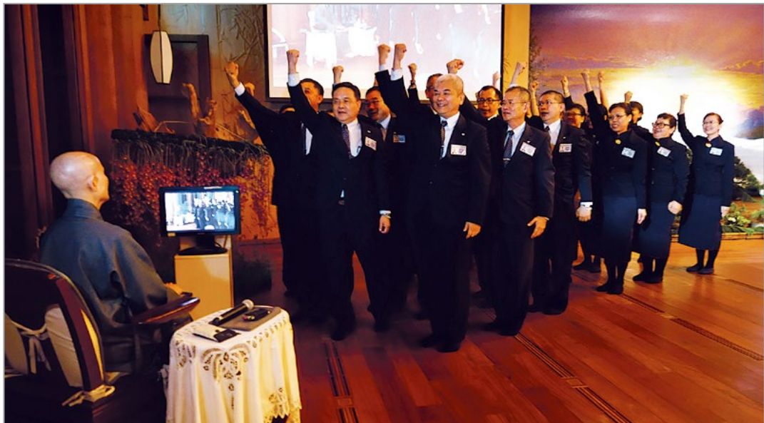
新加坡慈济人发愿“弘扬正法在人间”；上人勉众，法入心，才能自度度人。（4月14日）

《无量义经》：“微滂先堕，以淹欲尘。”说明即使是肉眼无法察觉的微小露水，持续而细密地出现，也可以滋润大地，不让沙尘随