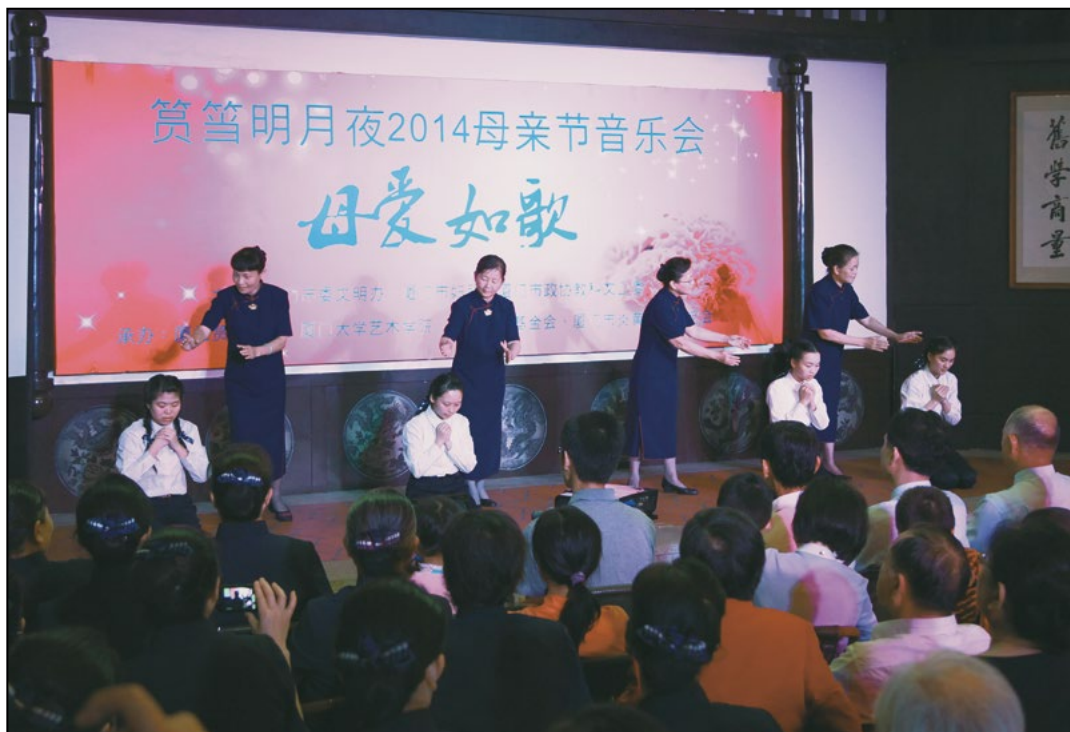
“簋笏明月夜二〇一四母亲节音乐会”，慈济志工以手语呈现《跪羊图》，传递孝的真谛。

由福建省厦门市委文明办、厦门市妇联、厦门市政协教科文卫委主办，厦门簋笏书院、厦门大学艺术学院、慈济慈善基金会、厦门炎黄文化研究会联合承办的“簋笏明月夜二〇一四母亲节音乐会”，五月十一日在簋笏书院上演，主题为“母爱如歌”。