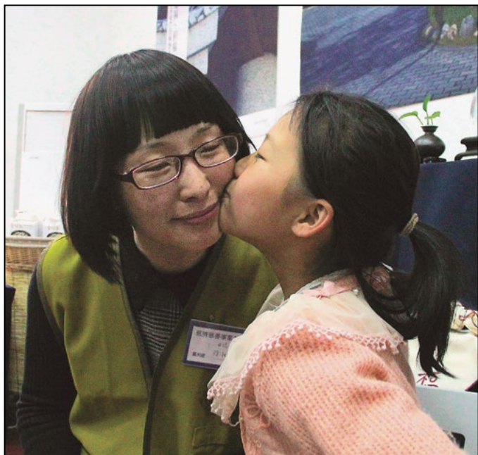
活动后，受启发的女儿给妈妈一个感恩的吻，千万感谢融入这温情一刻。