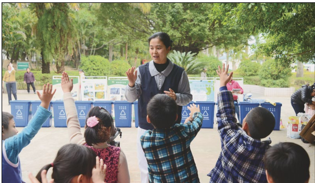
志工为同学们垃圾讲解分类，对于志工的提问同学们都举起小手积极参与进来，不甘落后。