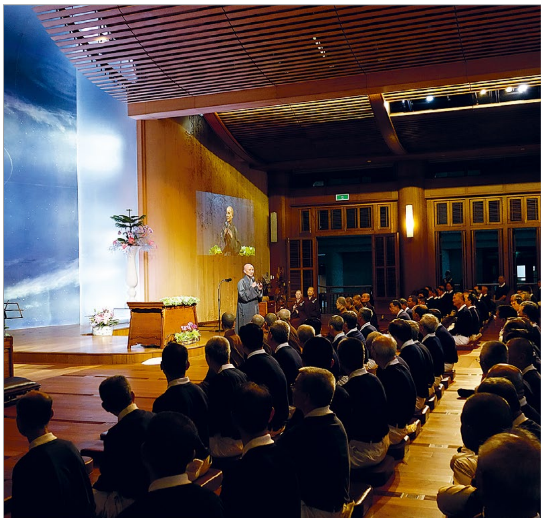
慈济四十八周年庆，全球约有一千六百位慈济人返回精舍，参与朝山、绕佛绕法。上人勉众勤耕心田，让善种子健康茁壮，成就大菩提林。（4月22日）

她有足够的能量再度牵起手足之情，家庭和好如初。学习佛法，就是要调整偏差的心态。”