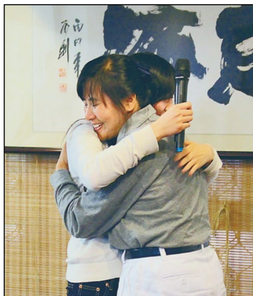
儿女为父亲、母亲浴足，动作也许不熟练，但彼此都收获了满满的幸福。

孝顺自己的父母，孩子才会孝顺自己。陈德权全家人一致认为：“这个活动真的很有意义！”