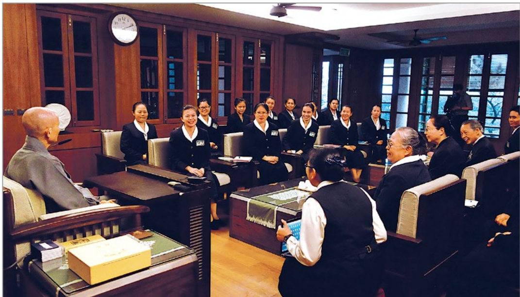
泰国清迈慈济学校校长来台参加“教师深耕人文培训营”，上人感恩大家合和互协，以身教为典范，让校园充满人文气氛。（4月30日）

上人谈到慈济大学模拟医学中心首创“临床模拟手术教学”课程，不仅让医学系实习医师有实际操作各种手术的机会，也开放海内外医学生、医疗人员参与。每一届的同学们皆以感恩、尊重的心情对待大体老师；解剖学课程结束后先到火葬场打扫，再送大体老师火化，并