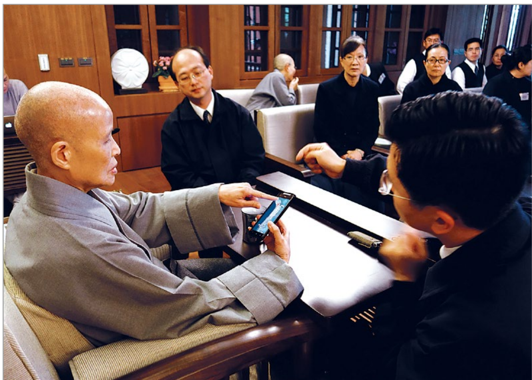
台湾时间上午七点四十五分，智利发生芮氏规模八点零强震。上人听取宗教处同仁报告，指示持续关注灾情，评估后续关怀行动。（4月2日）