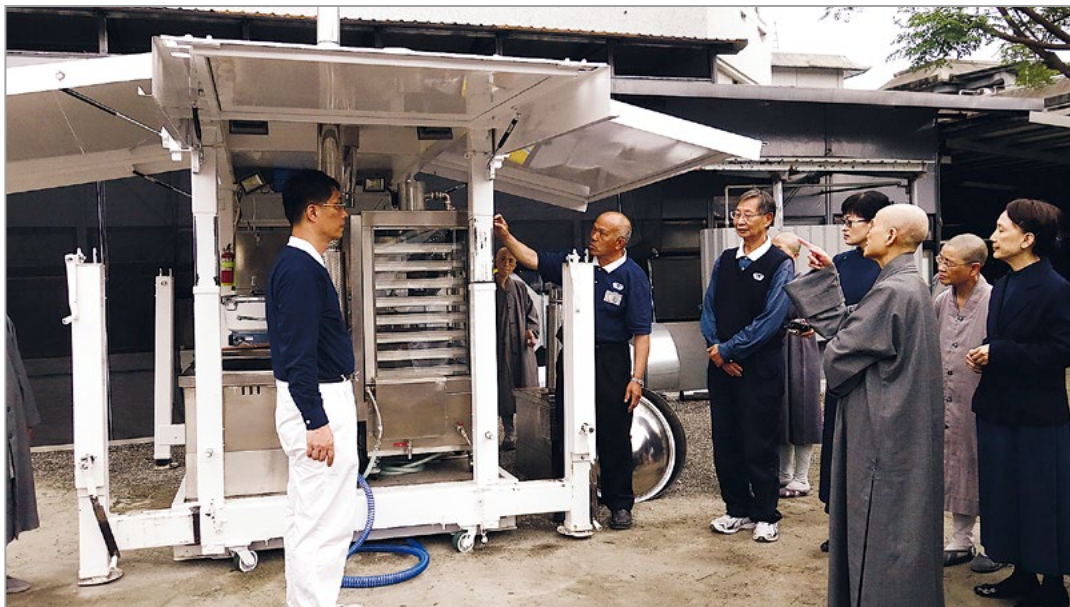
新竹蔡坚印师兄等人向上人介绍与工研院合作设计的新款多功能餐车，车内有六组独立炉灶，适用瓦斯或木柴。十八日将于慈济人道援助会研讨会中展示。（4月16日）

与菲律宾慈济人座谈，上人感恩大家在海燕风灾救援行动中，展现出“和”的力量，劳心劳力的