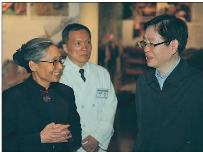
国家宗教事务局长王作安（右）莅临苏州慈济慈善志业中心参观，慈济基金会秘书长林碧玉（左）与苏州慈济门诊部院长林祐生（中）陪同参观。