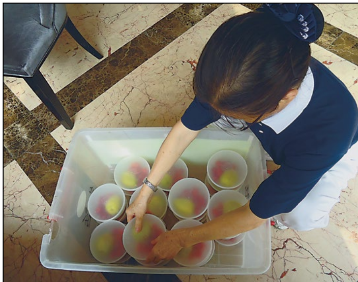
厦门慈济志工集合，为家属准备牛奶、面包、苹果和静思语等物品，前往接机，希望给予家属安定的力量。

在说明会之后，十五位慈济志工陪同家属前往医院关怀伤者，另有十一位志工陪同家属搭乘大巴，前往华安县事故现场。