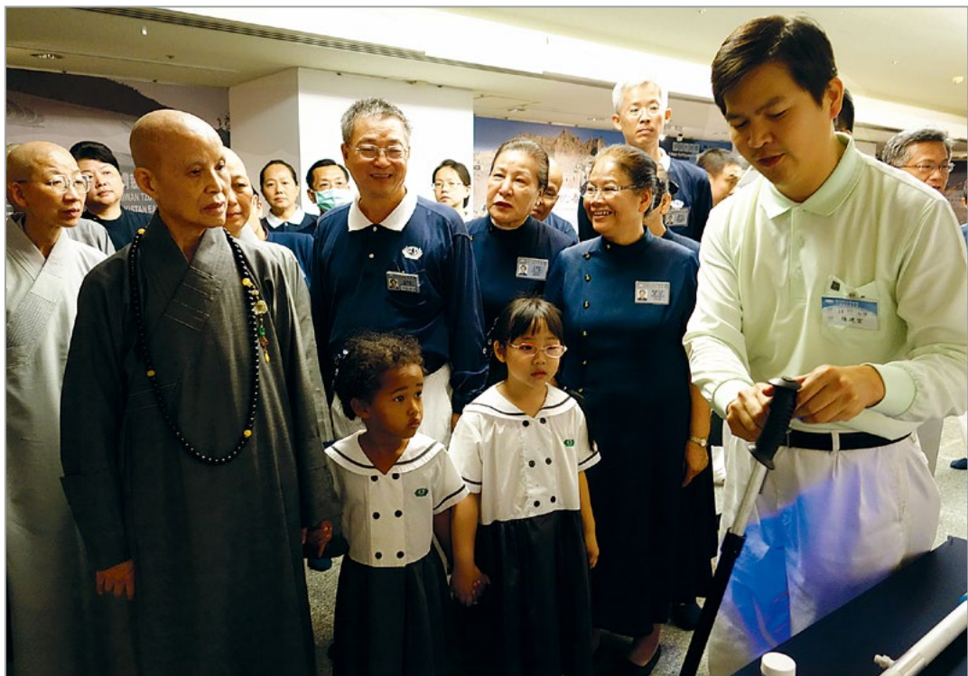
人援会研讨会第三天，上人前往静思堂参观各项研发产品，肯定大家用智慧行善法，真正利益人间。（4月20日）

“挖山取矿破坏大地环境、工业制造污染空气水源而取利，导致气候变迁、灾难频起，如此不顾后果的牟利是恶法。慈济人认环保重要性，惜福爱物、回收废弃物再制