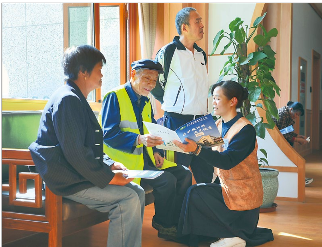
志工面带微笑，轻声细语的为环卫工人讲解各个健检项目。