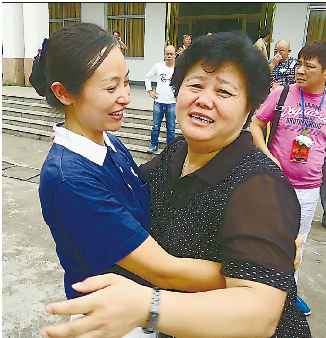
志工给予家属安定的力量，如同家人般陪伴到最后一刻。