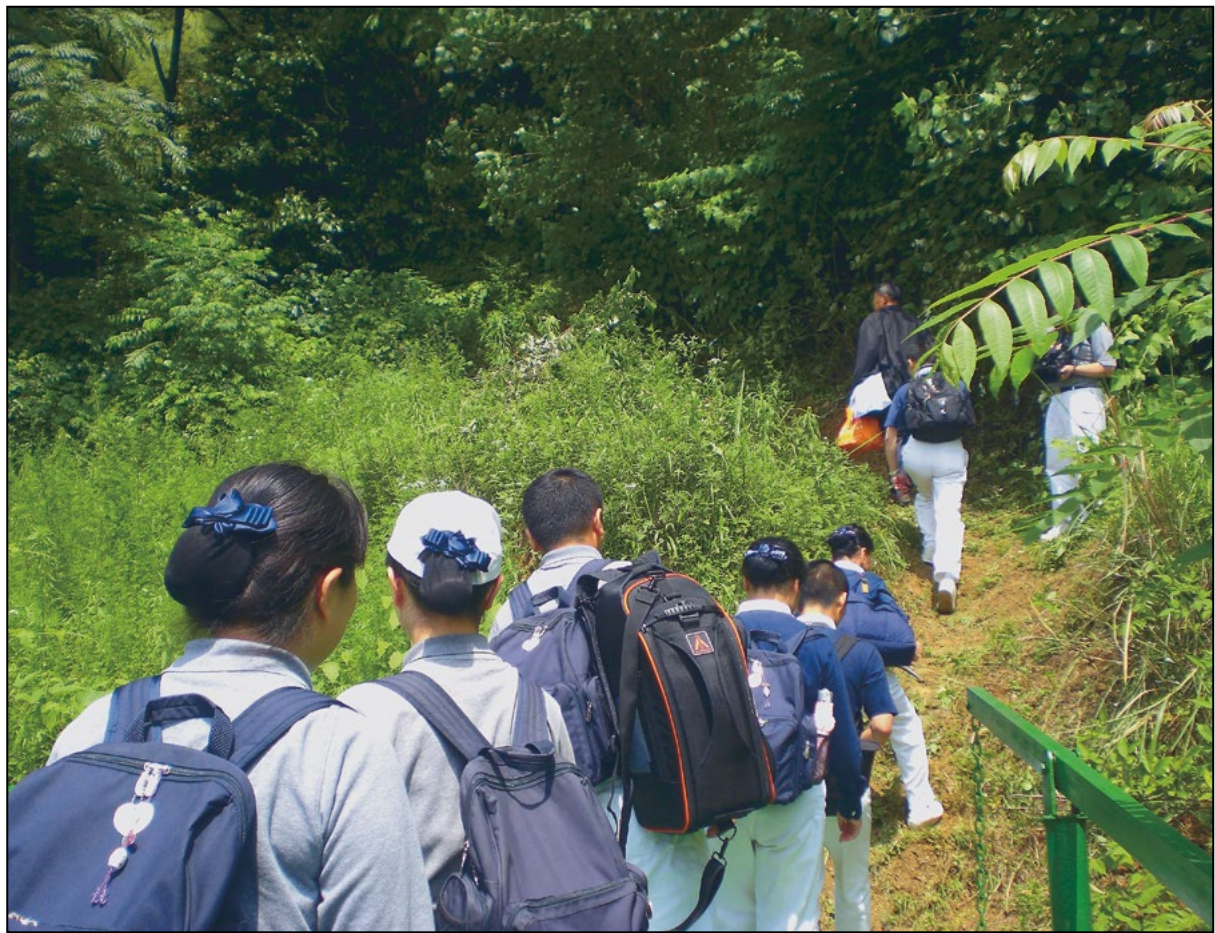
前往白竹慈济小学的进山小径，沿途多有山体滑坡的现象。志工多年来仍坚持步行前往关怀。

从一九九六学年至二〇〇三学年间，慈济每年资助二千多名小学和初中生；之后，随着政府为全省城乡义务教育阶段中小学生全部免除学杂费，于二〇〇九学年开始资助