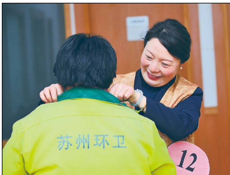
医疗志工对待环保工人如亲人一般，细心为家人整理衣角、仪容。

志工面带微笑，轻声细语的引导环卫工人接受各个项目的健检；在等待区，资深医师讲解日常生活中的健康常识。过去，因环卫工人工作分散、班次不同，人员流动性大、没有固定场所开办健康讲座，遂不知道高血压、糖尿病、颈椎、腰椎病等常见疾病的健康保健知