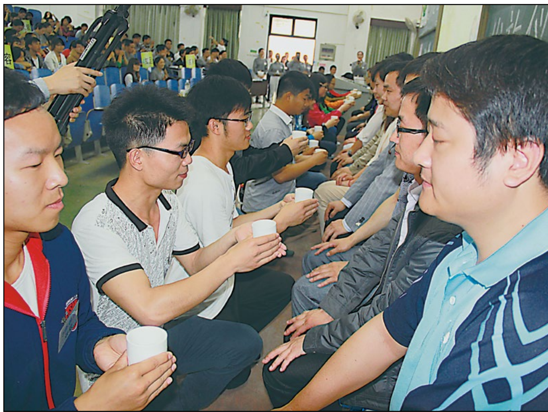
同学们给老师恭敬奉上三好茶，感谢师恩，善念回报，报恩就从此刻的感恩开始。