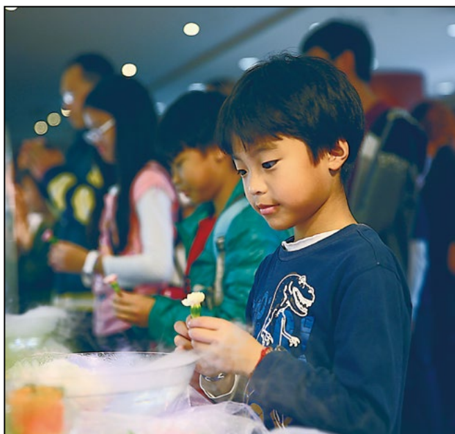
感恩茶会活动中，小朋友用心为母亲祈祷，祈祷母亲身体健康，世界祥和。

“孝亲祈福、助学圆梦”的茶会，在母亲节落幕，但慈济的助学行动，继续不辍，且用行善来行孝，获得志工很好的反响。 ❷