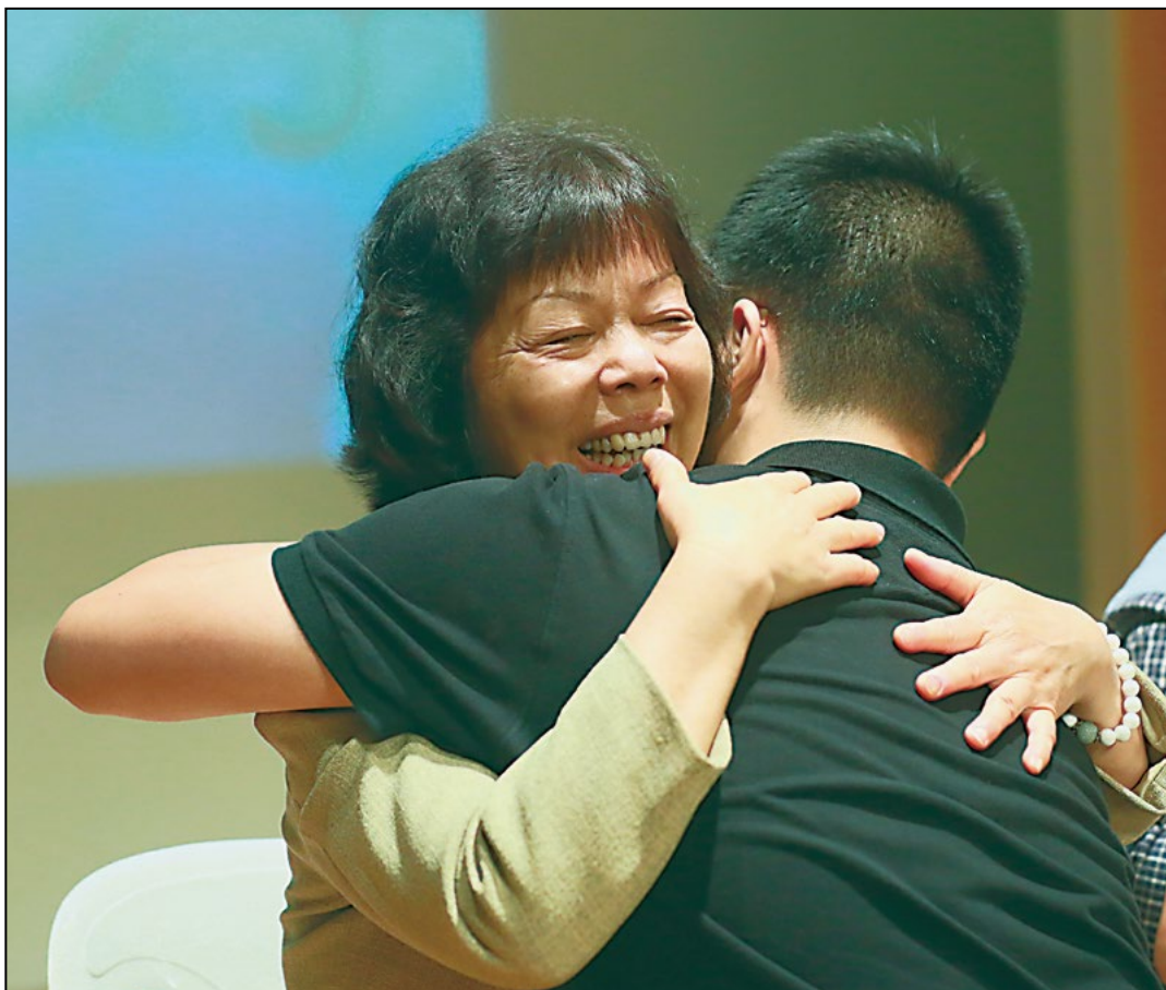
参加这次母亲节活动之后，幸福的母亲和儿子热泪相拥。