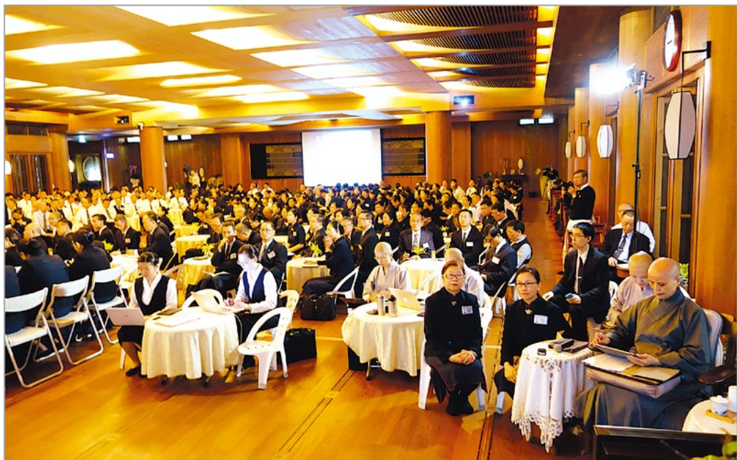
来自全球十七个国家地区、四百多位慈济家人归返心灵故乡，参与海外多国联合董事会。听取香港董事会务报告后，上人勉众合和互协，持续肤贫慰苦、济度人心。（4月11日）

香港热闹繁荣有“东方之珠”美称，但是大城市里也藏有苦难悲情。听闻香港慈济人分享关怀街友、长期与社区长者温馨互动、透过资源回收凝聚社区爱心等心得，上人感叹：“这正是人间苦、无常的真相。人间有苦，才需要人间菩萨现身关怀。期待大家合和互协，持续肤贫慰苦、济度人心。”