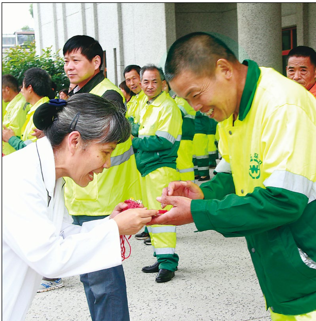
苏州慈济门诊部医疗同仁为“城市美容师们”献上健康祝福。