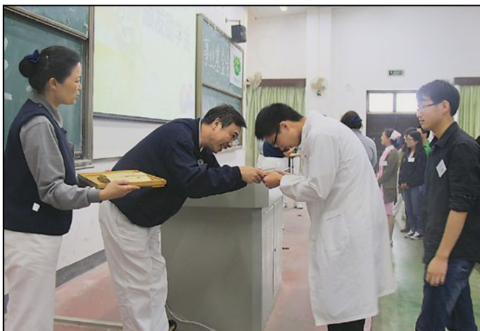
慈济志工向同学们弯腰奉上助学金，帮助同学解决上学困难，并予以鼓励。