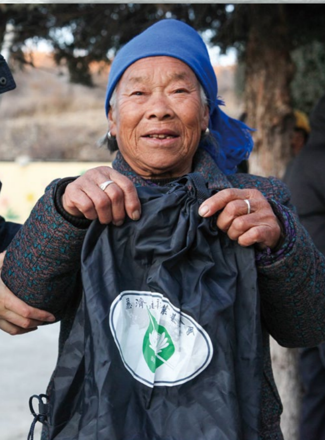
奶奶对志工说：“这个袋子忒好用了，我去赶集、走亲戚都背着。”志工向奶奶介绍物资及食用方法。

月刊里证严法师的照片。阿姨虽然没能见到证严法师，却从志工的介绍中了解了慈济。她拿出一张伍拾元纸币说：“这是我的心意，交给你们，也和你们帮助我们一样，去帮助其他地方的穷苦人。”