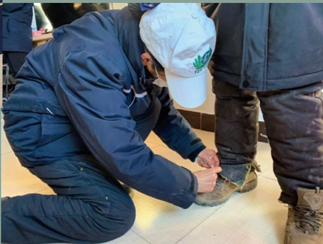
(右图) 李爷爷穿着新棉衣找到志工，不停地踏脚，向志工示意他换穿一双暖和的鞋子。