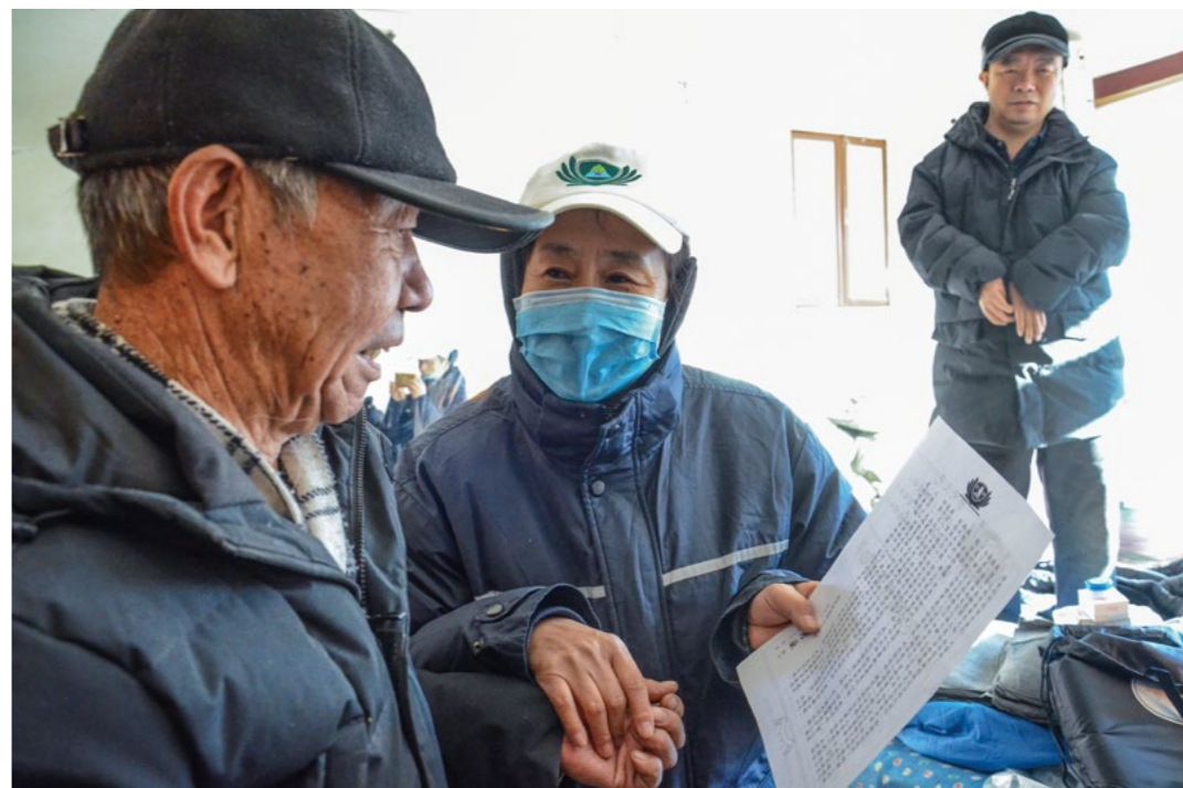
阿令一岁时得脑炎，妈妈身体不好，一家人全靠爸爸支撑，志工牵着阿令的爸爸读慰问信。摄影/魏莹

大家用心地宽慰着老人家，慢慢释怀的杨爸爸拉开了话匣子。原来阿令出生时，双手落下残疾，一岁时得脑炎，雪上加霜的是，杨妈