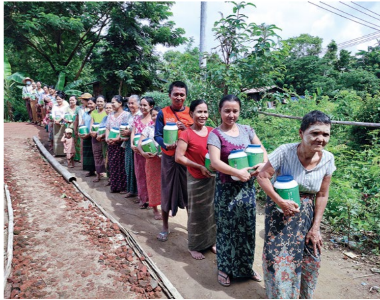
缅甸受助村民了解慈济竹筒岁月精神后，落实日存一把米，帮助其他贫穷家庭；数月后志工再次回到村落，举办米扑满回娘家。

无量”；上人期许人人打开心胸，将自己的爱心与他人的爱心会合，成为“无痕迹的爱”，可以无量延展，无论去到何处，都带着最为真诚的心，与人合和互协，付出无私大爱庇荫天下。