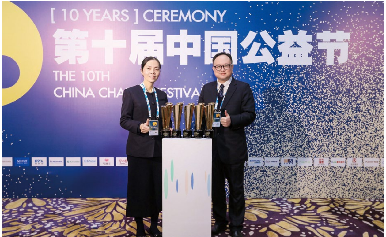
撰文/霍涛