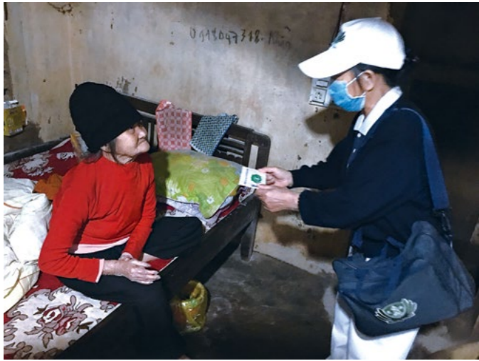
越南慈济志工十二月在风灾重灾区河静省与广平省赈灾，于景化社发放，对于年长、孱弱不能来现场的乡亲，配合政府干部到家捐赠。

的福愈大。“要让大家知道，量少没关系，即使是少少的零钱，日日点滴累积，也可以滴水成河；合人的点滴爱心，可以凝聚大力量，救济许多贫苦人。”