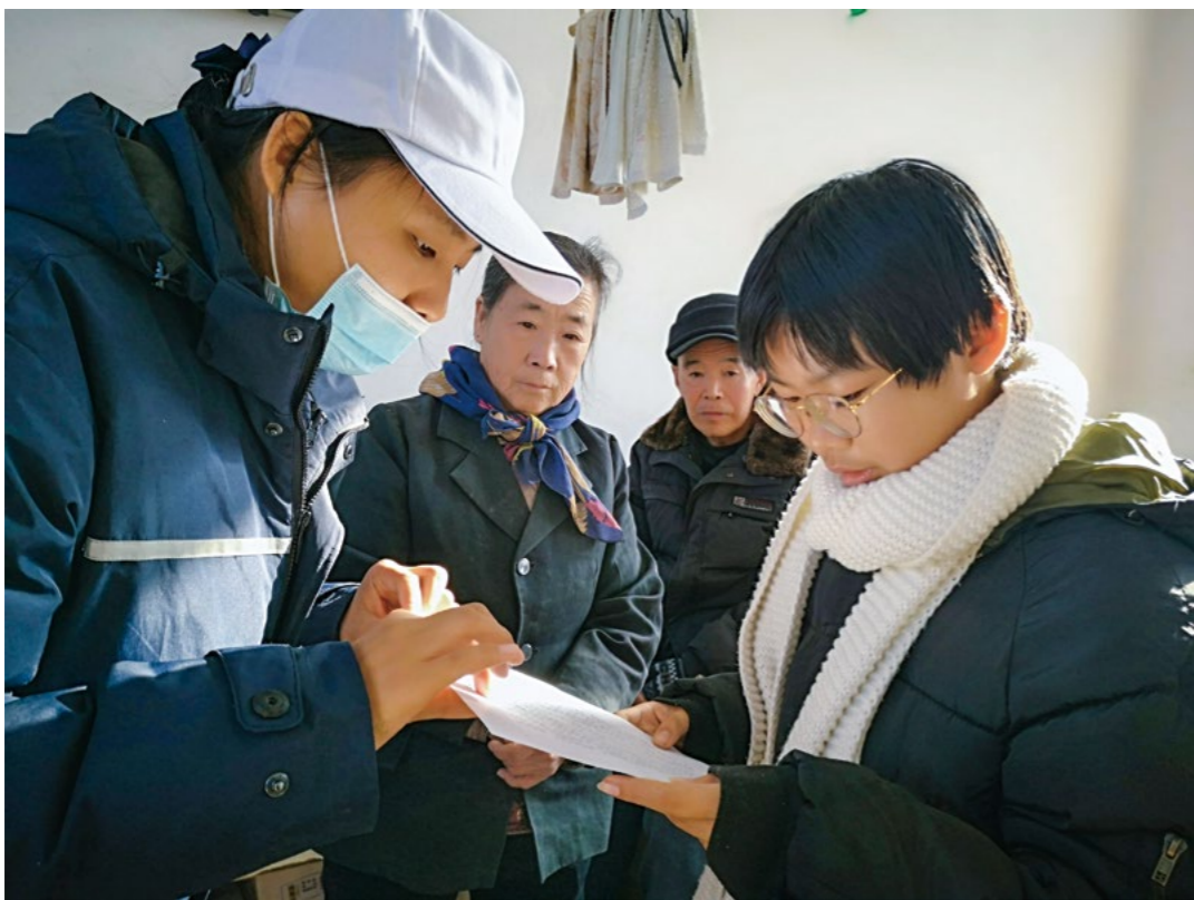
志工开导爷爷奶奶对小街姐弟要多祝福少说教，并与小街一起恭读证严法师的慰问信，还用静思语启发一家人的善念。

当志工奉上“静思语”条幅时，奶奶说：“你们来几回都留着呢。原来静思语都贴墙上，因为房子改造，就取下来了，但都保存着呢，一张也没弄没……这是纪念，让她们记住你们对我们的爱心帮助。”