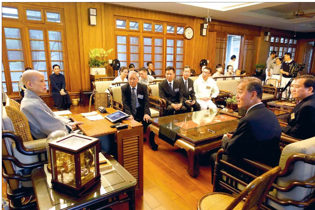
缅甸与马来西亚慈济志工返台报告，九月十九日到十月九日间，于缅甸水患灾区进行谷种发放事宜。上人感恩大家以诚与情，在灾后一片泥泞的道路中，走出平坦宽阔的菩提大道。（10月18日）

济人在第一时间就深入各灾区，提供短、中、长期援助，并援助五十所学校；在此同时，仍信守承诺对土耳其赈灾。