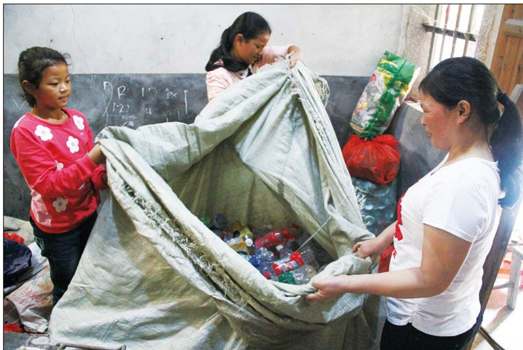
两个女儿受秀气的影响，回收后都主动分类。