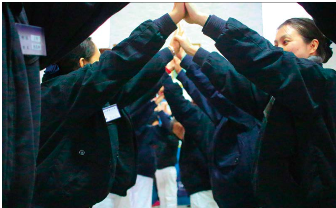
助学仪式最后，志工架起了爱心拱桥，欢笑与泪水流淌在每个人的脸上，更期待与孩子们下次有约。