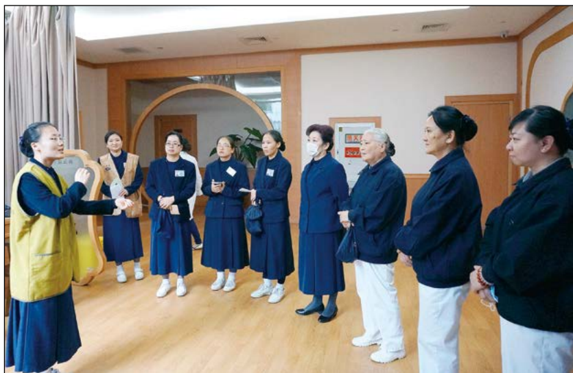
整齐的服装展现的是慈济志工认真学习的身影。

医疗志工的任务是关怀与陪伴，但也需要具备一定的医疗常识。十月三十日，苏州慈济门诊部再次举行医疗志工领队的培训，这样的培训在今年已经举办了两场，此次是今年最后的一次。学员都是从外地特地赶来参加的志工，下午一点课程正式展开。