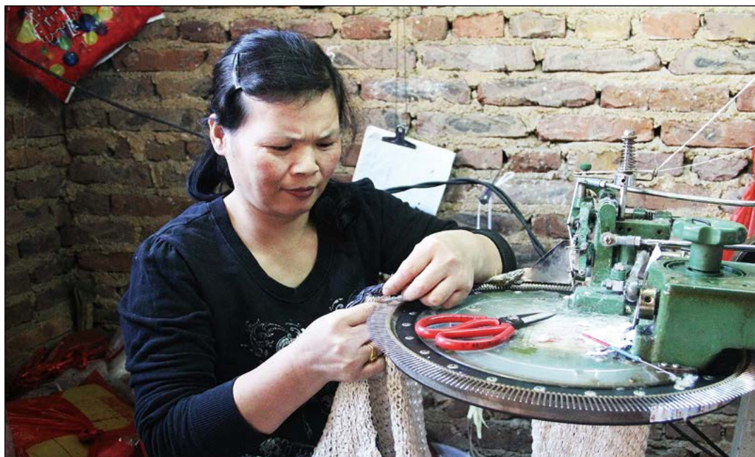
秀气对工作一丝不苟。她向志工分享“现在我不抱怨，只是想著我应该负起家庭的责任。”