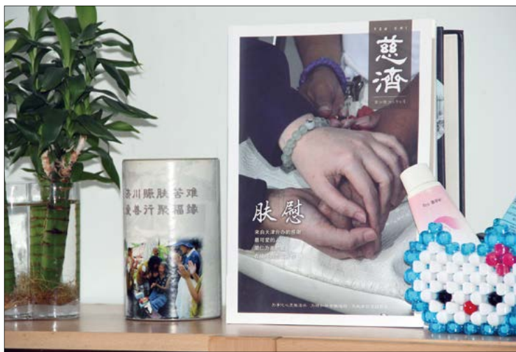
书柜上摆上竹筒和慈济月刊，还有志工特别送的观音竹，焕然一新。