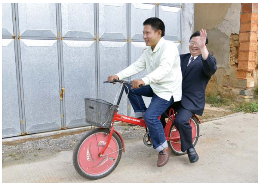
晓东用自行车载着院长回家，展示他努力康复的成果。

十八年来，罹患僵直性脊椎炎的他身体蜷曲两百度，无法像正常人一样站立，曾经的他终日躲在家