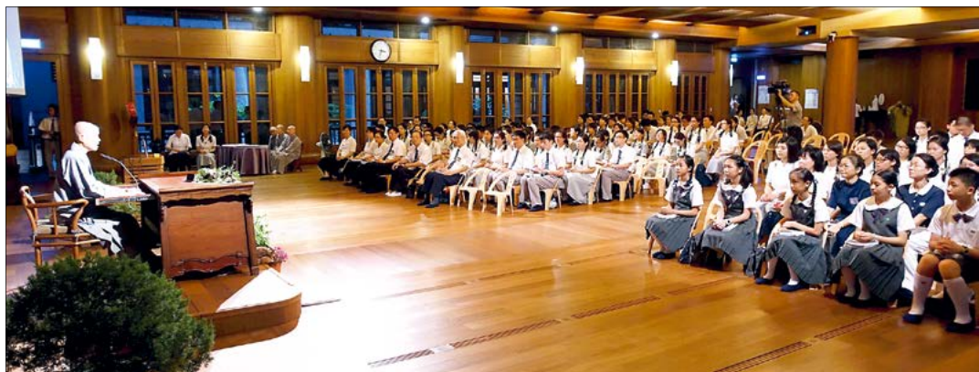
慈济大学、慈济科技大学与花莲慈中“暑期国际交流团”圆满，上人叮嘱，要珍惜就学期间能到海外学习、走苦难处“见苦知福”的机会，用功读书，朝正确人生方向精进。（10月3日）