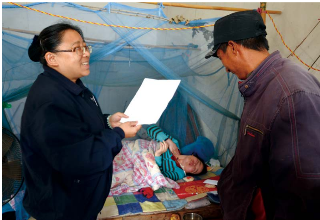
志工代替卧床的朱大姐向他丈夫道出一辈子的感激之情。