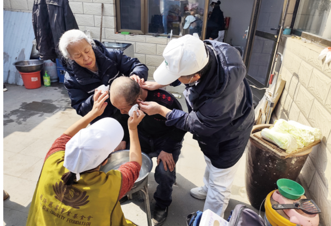
志工帮孔大爷洗头、洗脸，小心翼翼地修剪指甲，再换上干净衣物，涂好凡士林护手霜，悉心呵护老人干裂的双手。

大爷到河边散步。志工和孩子玩起打水漂，大爷站在桥上，望着水花一圈圈荡开，眉眼间满是幸福。