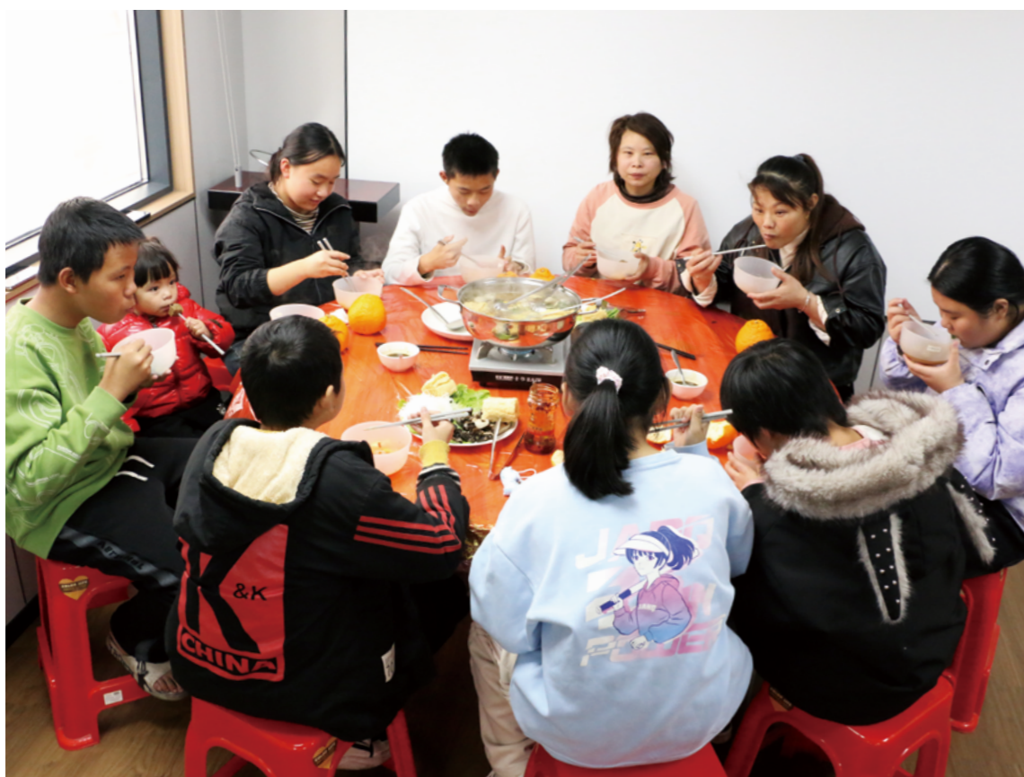
生活馆举办岁末围炉感恩会，在志工的邀请下，孩子们和家长纷纷前来帮忙。中午围炉，大家坐在一起享用蔬食火锅。

但在这里，她有了一起吃饭的伙伴，有耐心教她下棋的志工，还有每天换着花样的饭菜。她说：“以前中午就我一个人，现在有一大家子。”