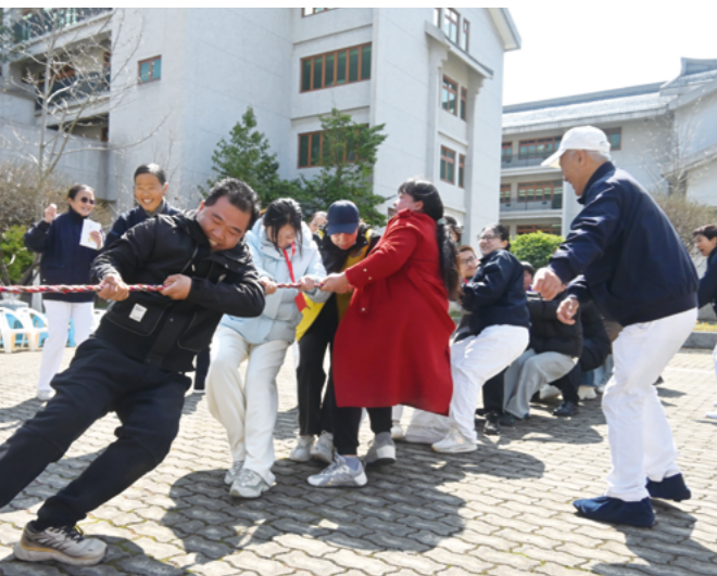
拔河比赛，比的是团结的力量。绳子在大人和孩子手中绷得像一根铁棍。两边都涨红了脸，拉拉队的喊声几乎掀翻了广场。

有更深的意义，善与恶拔河，谁会赢？答案是人多的一方赢。所以，我们要把善的力量聚集在一起。”