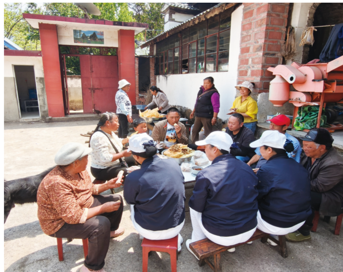
小院里，大家围坐一起，桌上摆满当地特色美食，还有志工带来的漾濞凉卷粉和方便面，嚼一口满嘴香，越吃越高兴。

苍山洱海笑颜开，笑颜开 噻啰哩、噻啰哩、噻啰 远方的客人请你留下来， 留下来……” 歌声在山谷里回荡。