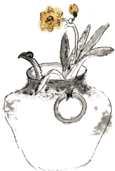
画作 / 黄逸樵

时间在秒秒、分分中度过。每晚天黑准备休息了，若是身体调和，一躺下去眼睛闭上，再次听到声音时，天已经亮了，又是新的一天，二十四小时就是这样在不知不觉间流逝。