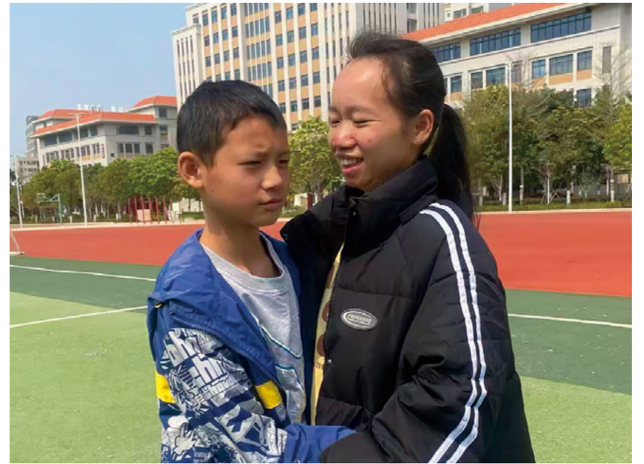
(左图) “横扫千军”游戏开始，孩子们身姿矫健、反应敏捷，在躲闪、跳跃与配合间尽显力量与专注。