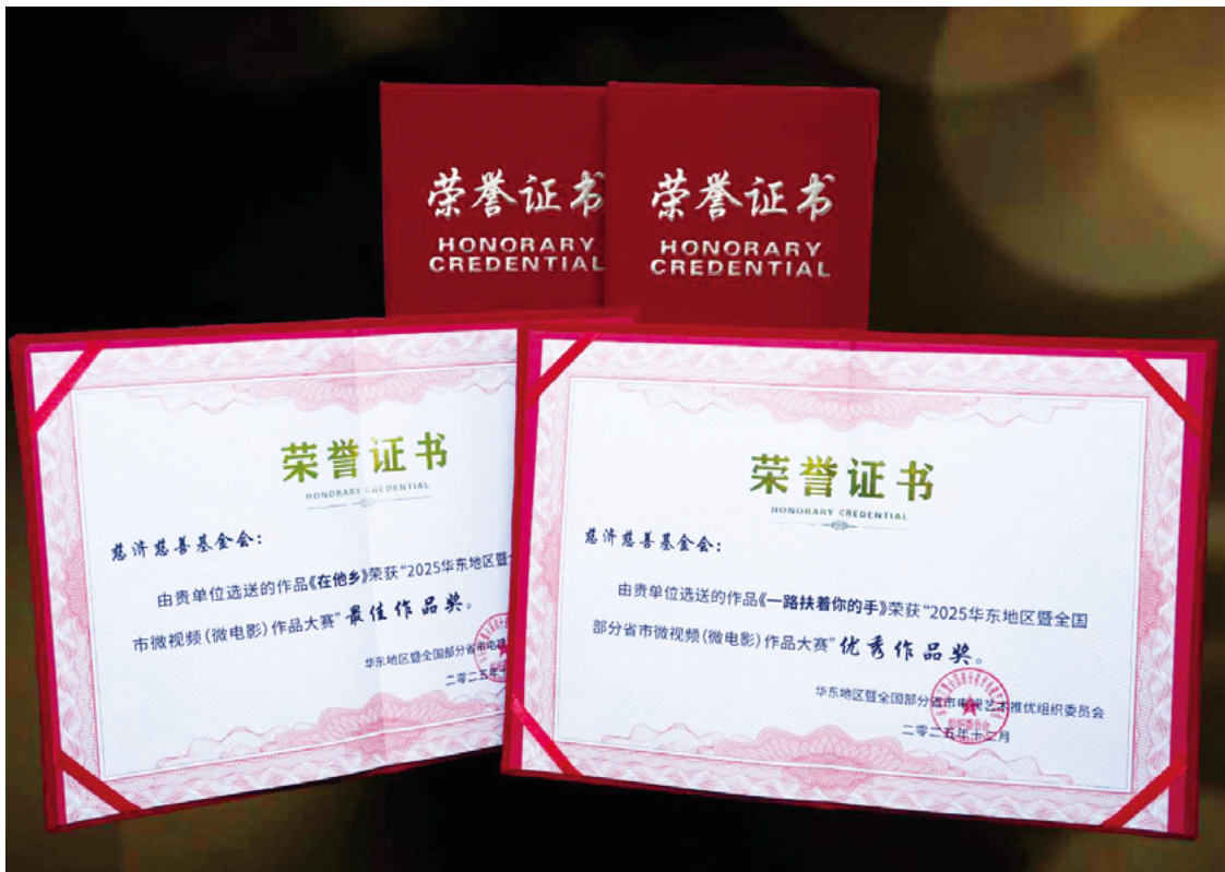
撰文/摄影 慈济基金会