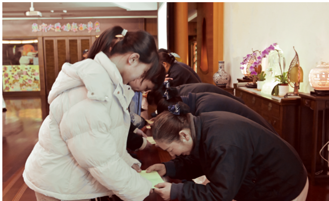
志工恭敬地为助学金递上助学金，也送上真诚的祝福，期待孩子们在一个充满爱和快乐的氛围中健康成长。

台下，头发花白的崔爷爷一直拿着手机，给台上的孙子拍照。又给女儿编辑消息——写了删、删了写，最后给女儿发了两张照片并写了两句话——“从右边数，第二个是我孙子。”接着