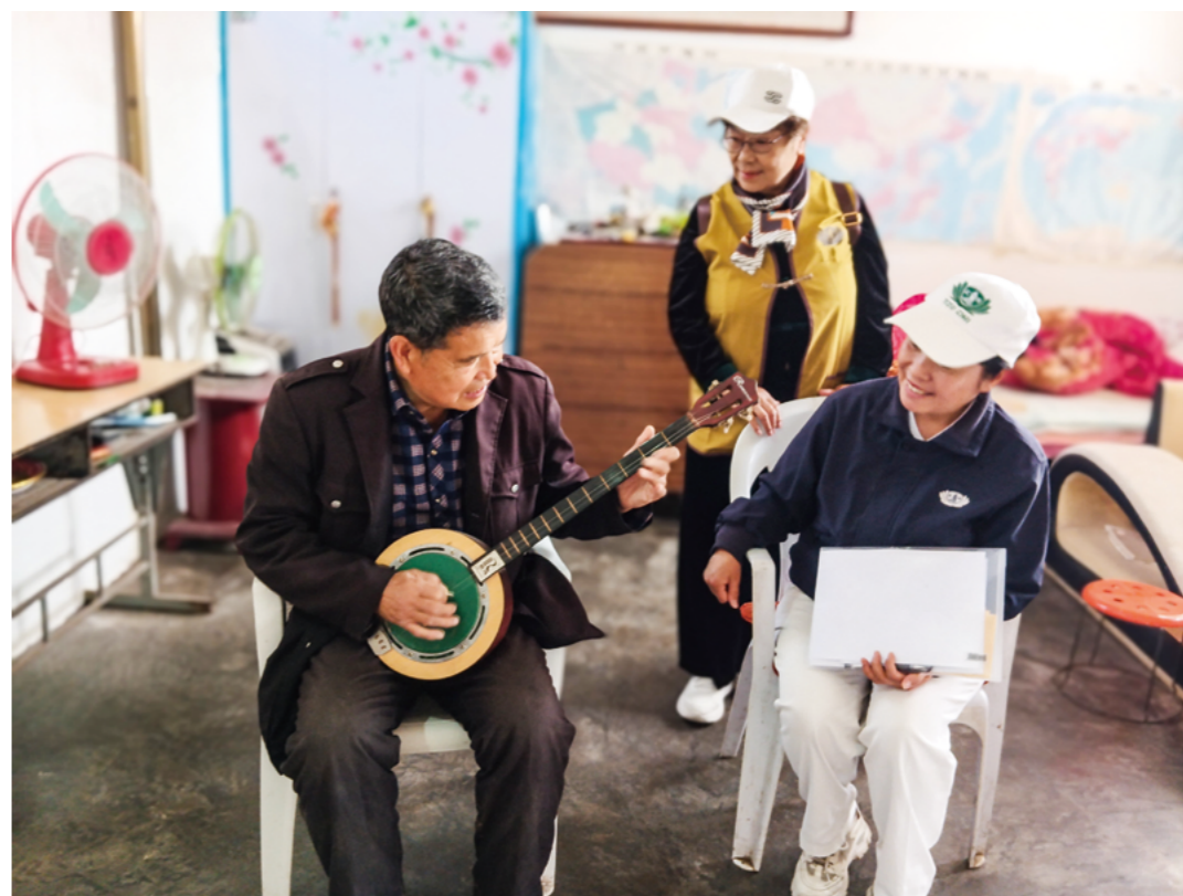
甜甜的爷爷早上练字，下午拉琴。他表示，非常愿意参加慈济的活动，还能参与表演。说着，他拿起一把秦琴演奏起来。