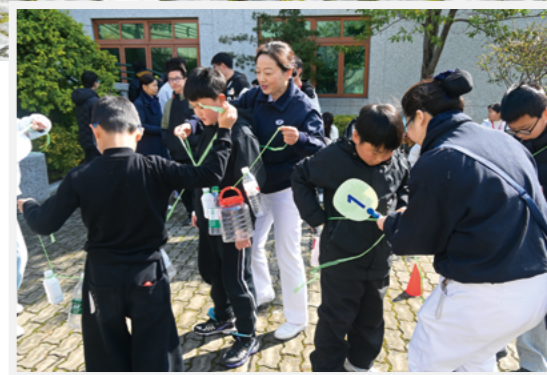
（下图）志工找来许多清洗干净的塑料瓶，用绳子系成一串。比赛时，装着沙子的“毛毛虫”要绕在运动员腰上或背在后背。

撞，发出“啪嗒啪嗒”的响声。有的孩子跑得很快，瓶子也跟着在身后飞起来，增加了阻力。