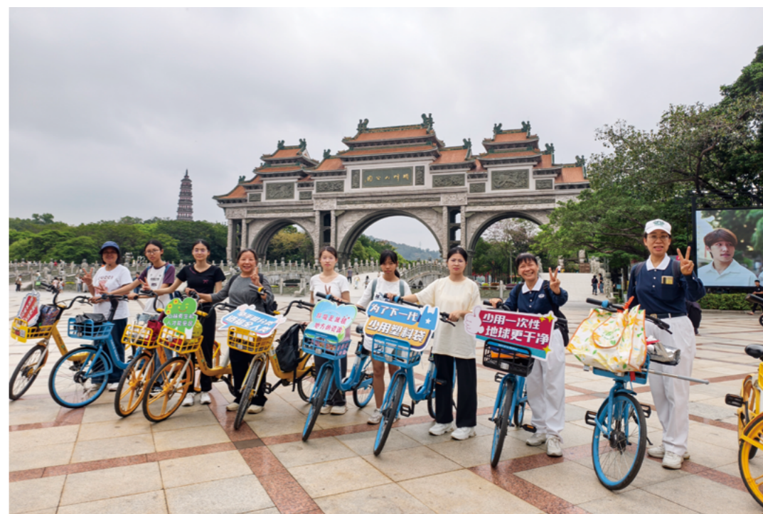
在顺峰山公园，第十五组的学子们与志工骑着共享单车，手持环保标语牌，向过往游客倡导环保理念。