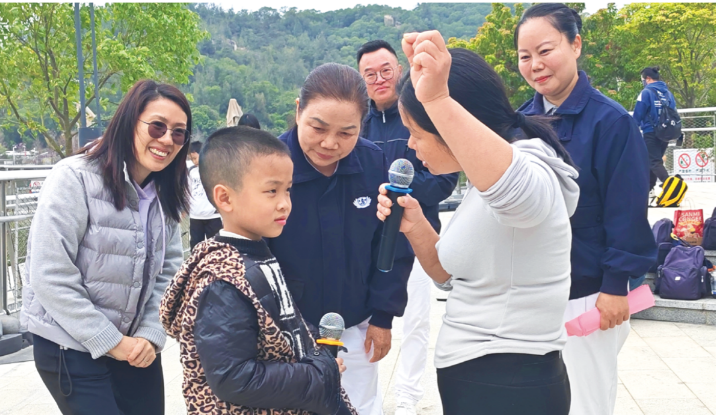
杨妈妈对小杰说：“儿子加油，我们在顶峰见，好吗？”话刚说完，自己先忍不住哭了。丈夫突然离世，她经常以泪洗面。