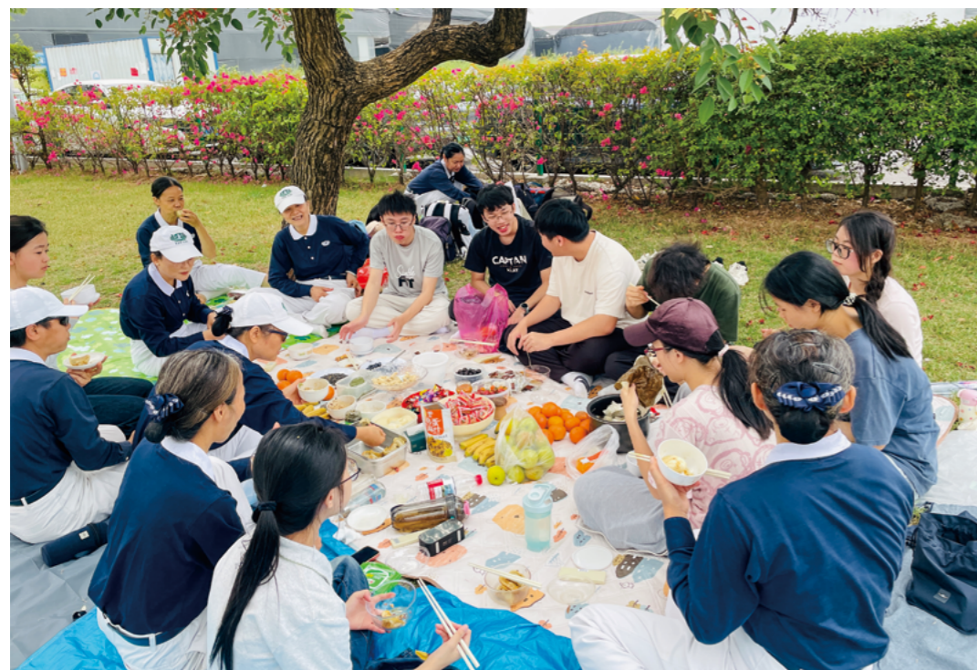
大家盘坐在野餐垫上，享用志工做的马蹄糕、南瓜馒头，还有从家里带来的水果、零食、饺子和青团等美食。

第十组在海珠湖。志工一句“最近怎么样呀”，就让学子们打开了话匣子——有人倾诉学业压力，有人说起家庭烦恼。志工耐心开导，为每一个小成就喝彩。