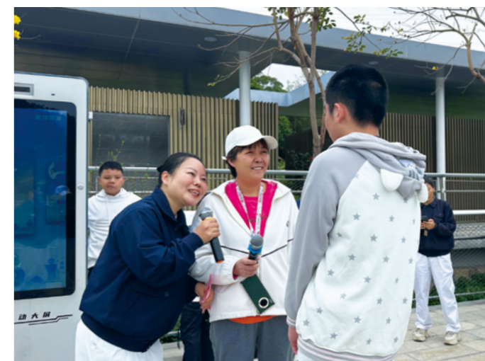
在“爱要大声说出来”环节中，小童勇敢地走上前，声音闷闷地说：“妈妈，感谢您从小养育我，保护我！”