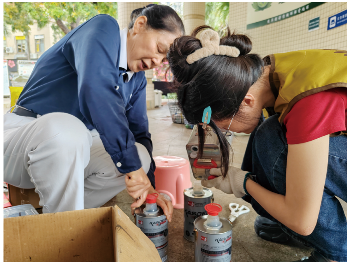
志工简雪环亲手示范：“在回收的废油罐瓶身钻两个小孔，一孔出液，一孔通气，利用气压就能把废油流干净。”