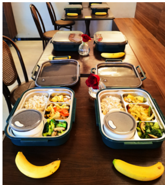
中午11点半前，色香味俱全的三菜一汤，配上香蕉，已整齐摆上餐桌，静待用餐孩子们的到来。

2025年国庆假期，泉州志工在助学访视中发现，新一批初中助学生普遍存在一个难题：学校不提供寄宿，中午教学楼要清场，而父母要么在工厂赶工，要么生病或打零工，根本没法接送。有的孩子随便买个面包蹲在校门口吃，有的干脆饿着肚子等下午上课。