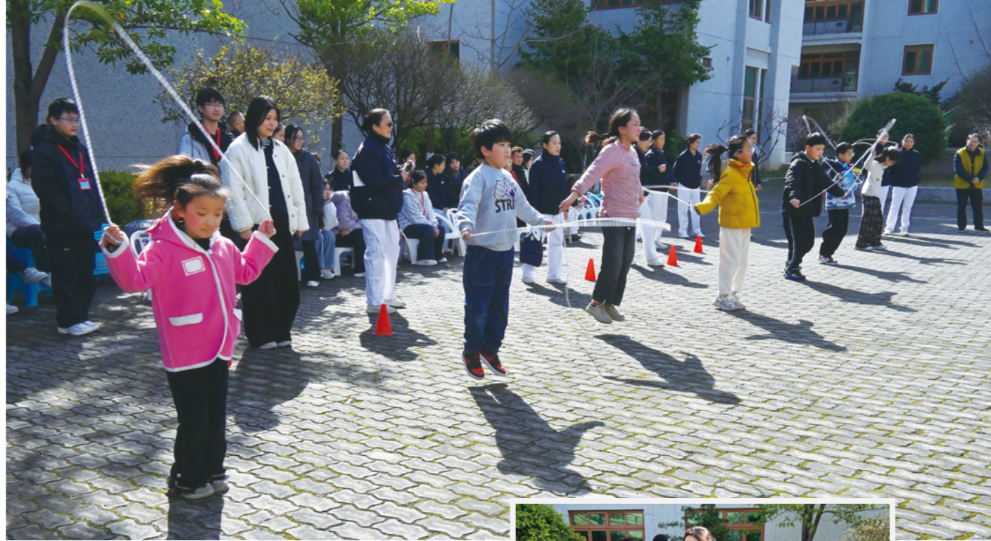
（上图）跳绳作为小学生体育课必考项目，孩子们对此格外熟悉。大家按年级分成两组，自愿报名，两列队伍面对面站立。摄影/黄国真

原来是志工找来许多清洗干净的塑料瓶，白色、绿色、红色，用绳子系成一串，挂在树枝上，像一条彩色毛毛虫。有的瓶子里，还装着一些沙子。比赛时，毛毛虫要绕在运动员腰上或背在后背，起跑后，瓶子相互碰