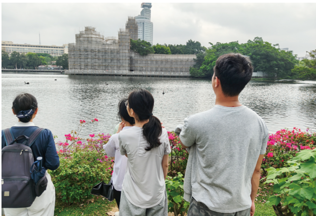
流花湖公园里的黑天鹅在湖面优雅游弋，白鸭于碧波中悠然嬉戏，碧水绿树相映成趣，大家一起感受大自然和谐共生的美好。