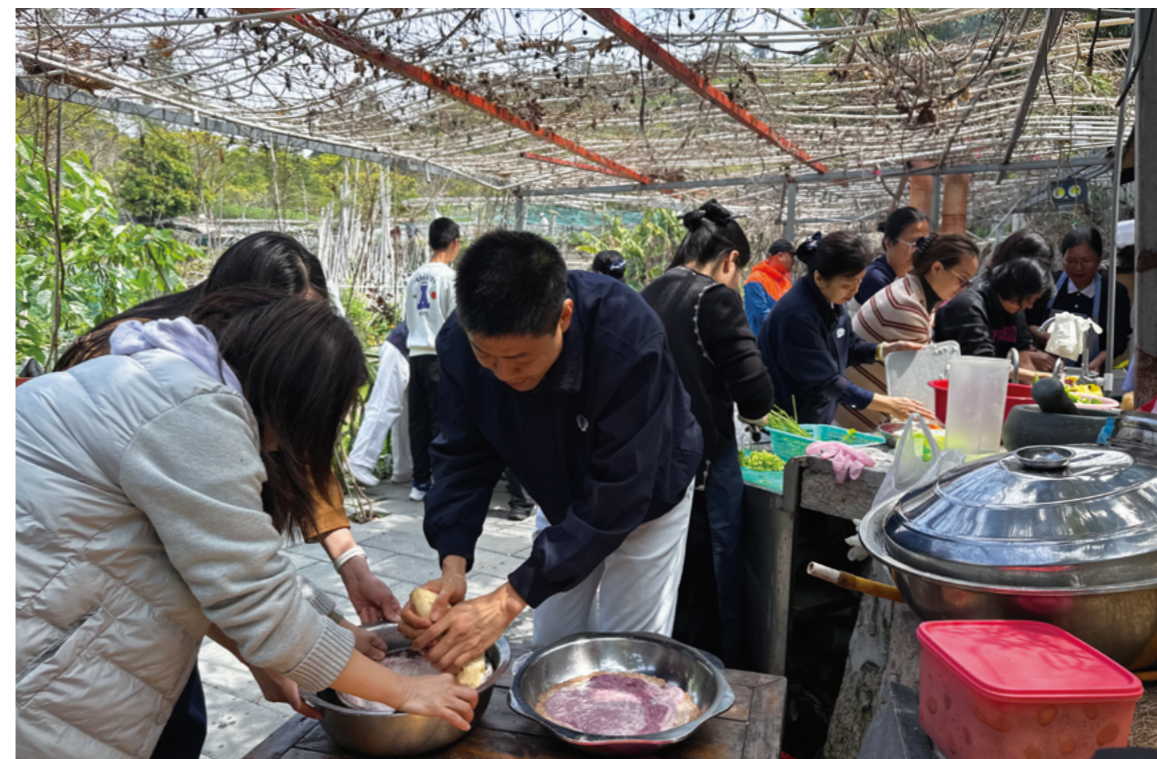
农场的大锅灶里飘出香喷喷的味道。志工早早在忙了——洗菜、切菜、剁馅、调料。有人捏青团，有人包春卷……

孩子们一到，就围上了桌。薄薄的春卷皮一张张被撕开，再小心翼翼地拿起。小睿也开始干活了，包了一