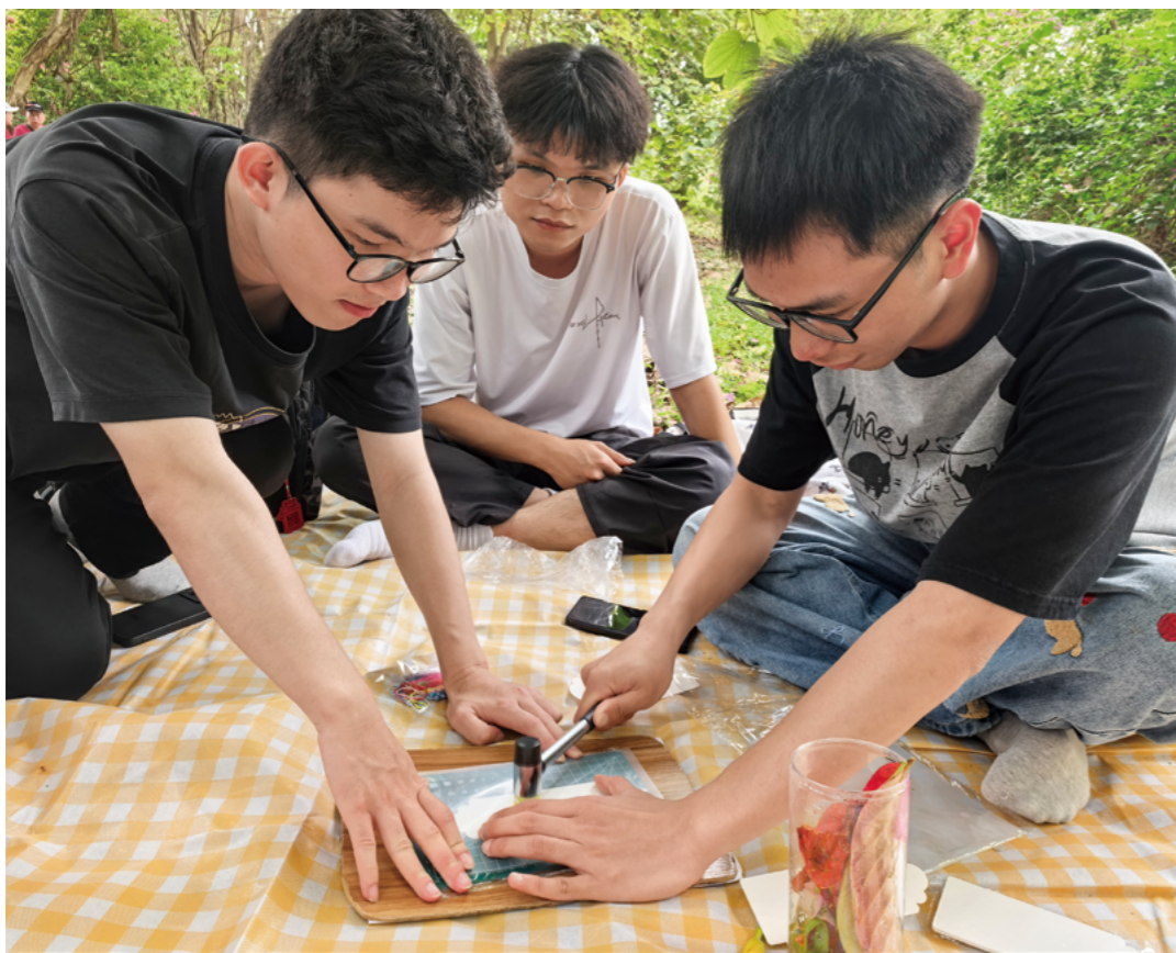
小辉（右）用小锤子敲打，把花草的汁液和形状印在书签上。初期因花叶的新鲜度不同，敲成了“抽象派”书签。