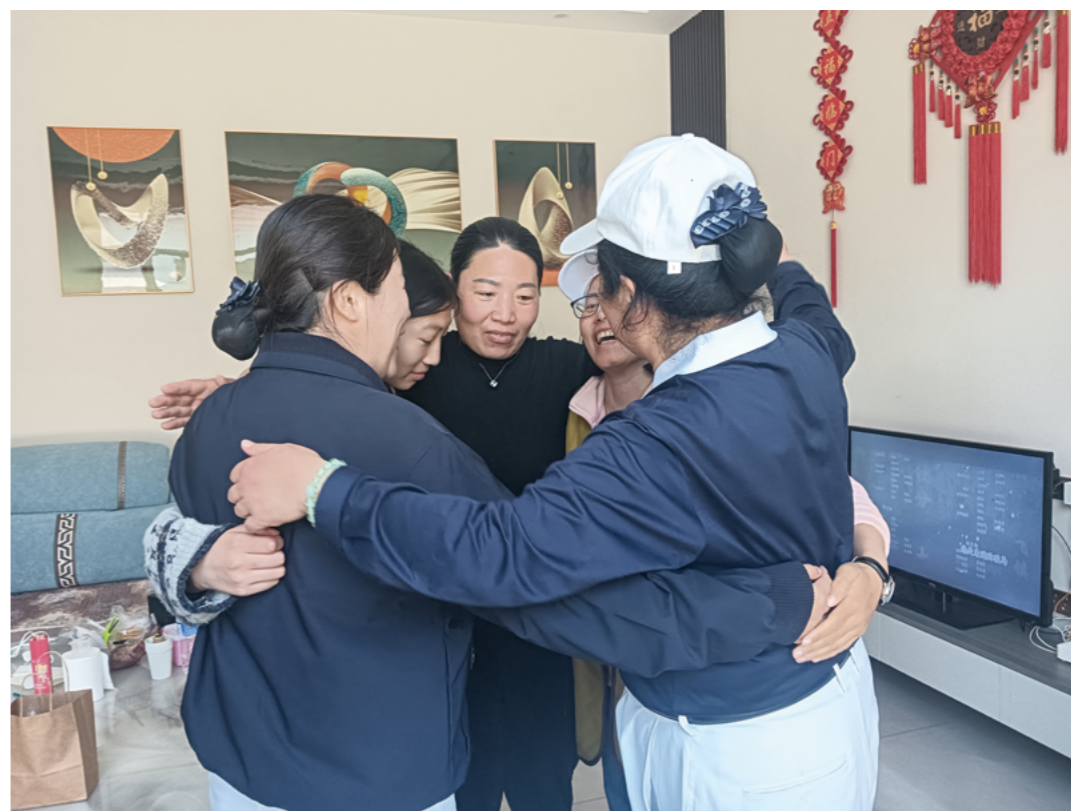
志工拉着小苒和妈妈围成一个圈。志工轻轻摸着小苒的肩膀，握着妈妈的手，给她们温暖的拥抱。