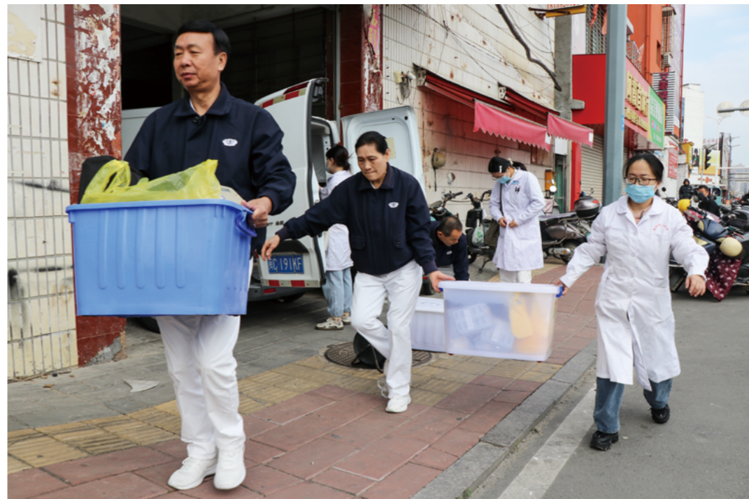
8点刚过，中心血站医护团队抵达。志工与医护搬运设备、设立体检区和初筛区，用行动传递温暖和力量。