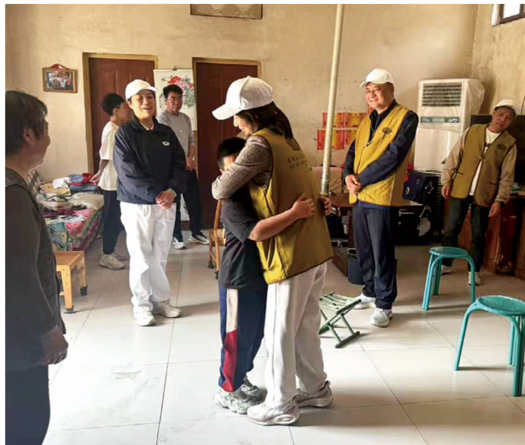
三年的陪伴让小豪改变很大。再次见到熟悉的志工与志愿者，小豪与大家一一拥抱，此刻只有拥抱才能表达彼此的温情。

在志工一遍遍温柔鼓励下，小豪终于抬起头，挺直身子，向五位志工和志愿者认真地做了自我介绍，小脸