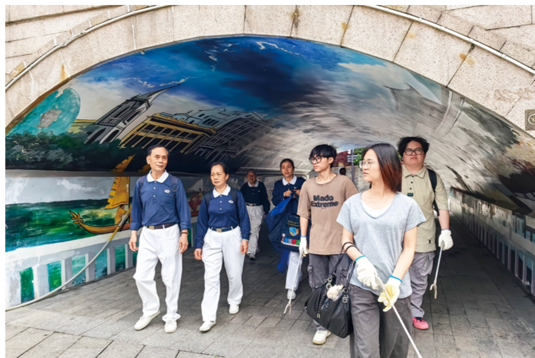
第十八组的目的地是荔枝湾涌。学子们兴致勃勃地欣赏西关大屋、听粤剧、看游船，了解荔枝湾涌的历史。

来自湖南的一位志工，曾因烧伤留下疤痕，但她依旧坚强乐观。她分享自己被慈济温暖的故事，还教大家摄影技巧，并告诉大家：“真正的光芒，从来都源于一颗永不放弃、始终